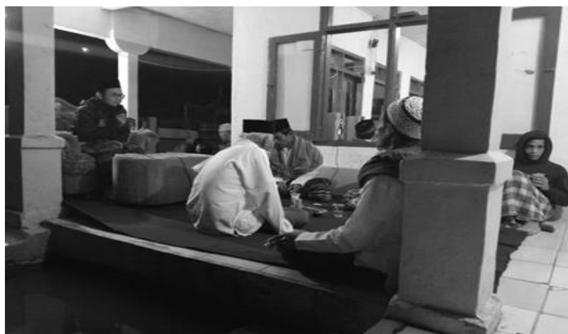
Gambar 3. Sosialisasi bidang strategi pemasaran hasil alam terhadap masyarakat.

Antusias serta respon warga dinilai baik karena rasa ingin tahu warga di dusun Cilubang ini dirasakan sangat tinggi, terbukti banyakwarga yang datang mengikuti serangkaian kegiatan ini dari awal hingga akhir.