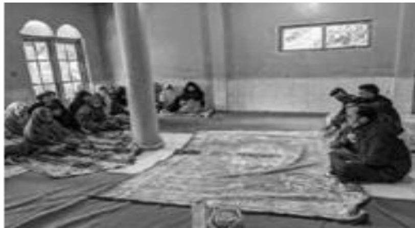
Gambar 2. Sosialisasi pemasaran hasil UMKM kepada para ibu sekitar

Pendataan pemasaran hasil alam bertujuan untuk mengetahui sejauh mana produk yang dihasilkan dapat dipasarkan dan diterima dipasaran.