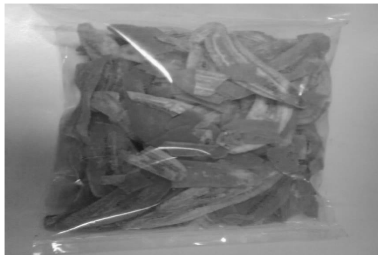
Gambar 5. Contoh kemasan keripik pisang