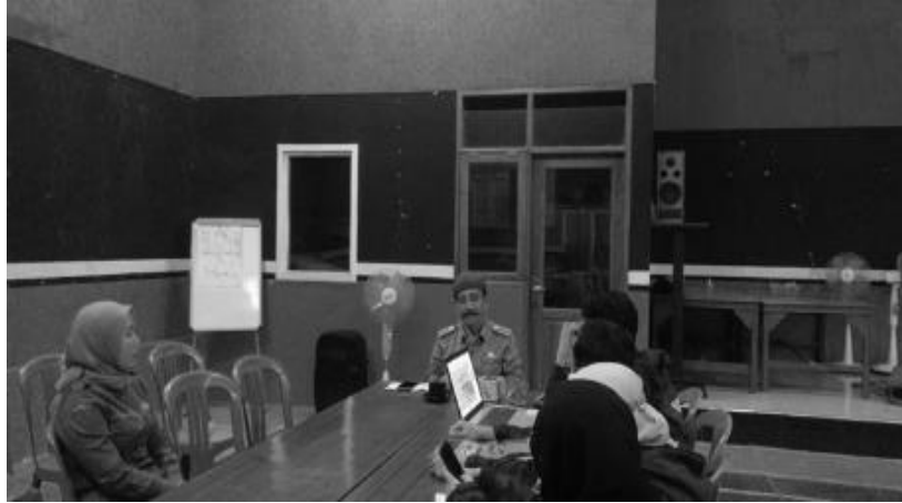
Gambar 1. Pendataan pemasaran hasil alam di kantor desa Bencoy

Pendataan pemasaran hasil alam bertujuan untuk mengetahui sejauh mana produk yang dihasilkan dapat dipasarkan dan diterima dipasaran.