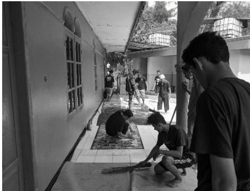
Gambar 1. Kegiatan jum'at bersih