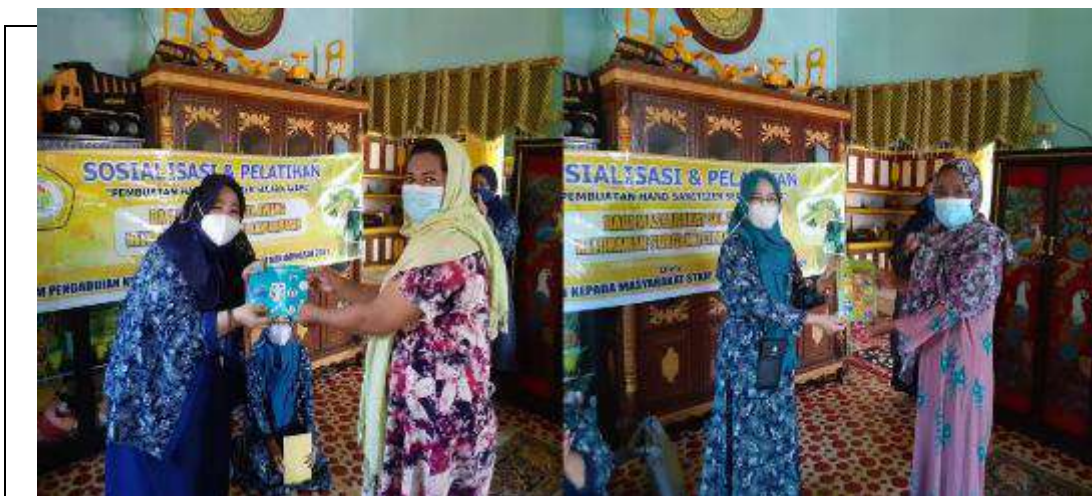
Gambar L7.3. Penyerahan Brosur 1