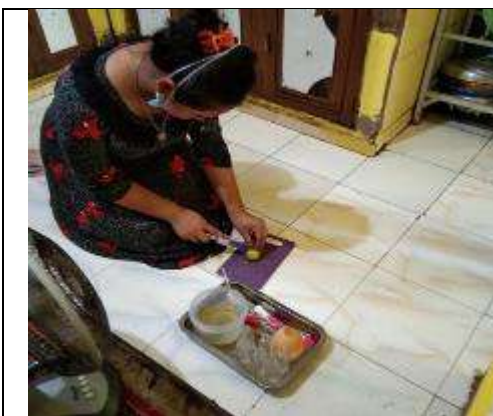
Gambar L7.17. Persiapan Pencampuran Bahan