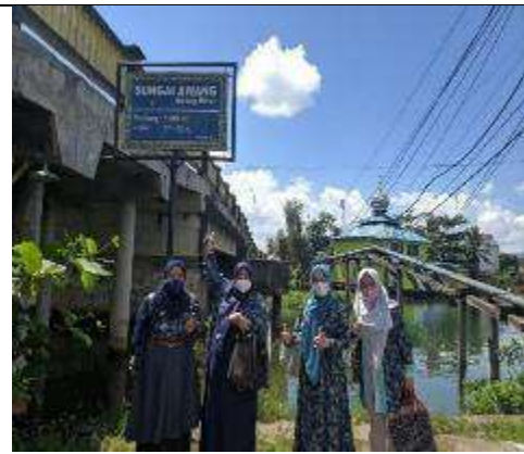
Gambar L7.14. Lokasi Kegiatan: Sungai Awang