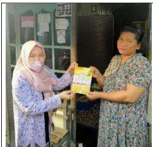
Gambar L7.5. Penyerahan Brosur 3