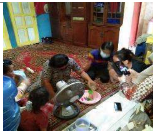
Gambar L7.20. Memasukkan Hand Sanitizer ke dalam Botol Spray