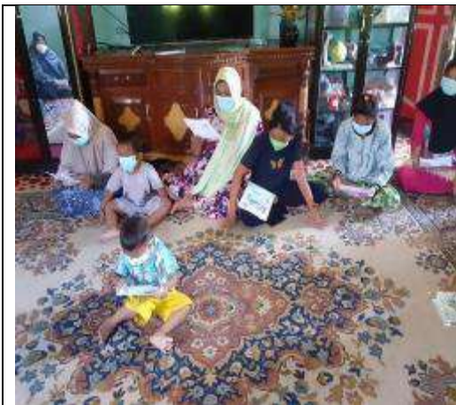
Gambar L7.7. Peserta Kegiatan Membaca Brosur yang Diberikan