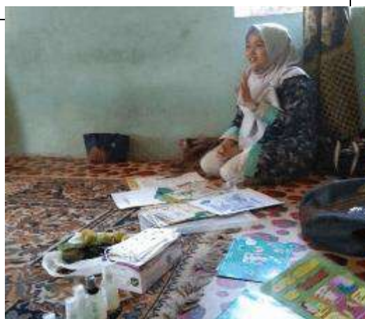
Gambar L7.11. Penyampaian Informasi Mengenai Hand Sanitizer