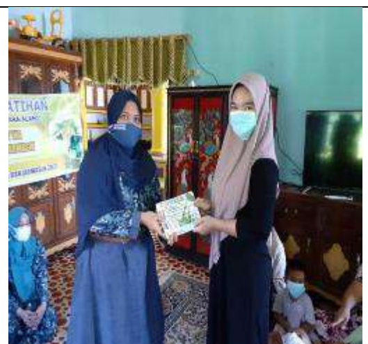
Gambar L7.6. Penyerahan Brosur 4