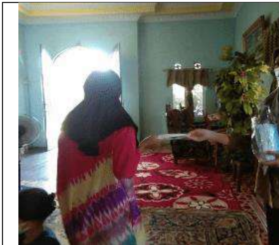
Gambar L7.1. Pembagian Masker