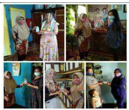
Gambar L7.22. Penyerahan Souvenir