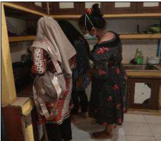
Gambar L7.15. Proses Perebusan Daun sirih