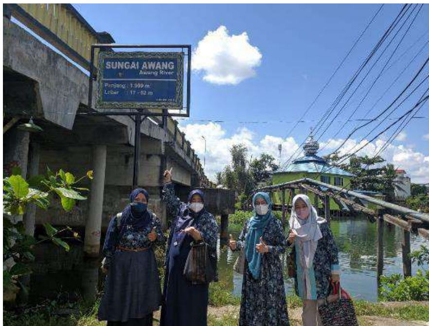
Gambar 1.1 Sei. Awang

Informasi mengenai lokasi mitra cukup sulit ditemukan di internet, padahal lokasi ini masih berada di wilayah kota Banjarmasin. Sangat sedikit informasi yang bisa didapat mengenai lokasi mitra. Berdasarkan informasi yang didapat, sungai tersebut dinamakan Sungai Awang karena sungainya yang panjang, jauh dari pemukiman dan dalam serta lebar. Sungai Awang bisa juga disebut dengan Sei. Awang memiliki panjang 1,999 meter dengan lebar 17-62 meter. Gambaran lokasi Sei. Awang disajikan pada Gambar 1.1. di bawah ini.