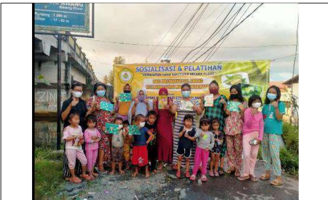
Gambar L7.23. Peserta Kegiatan Sosialisasi & Pelatihan