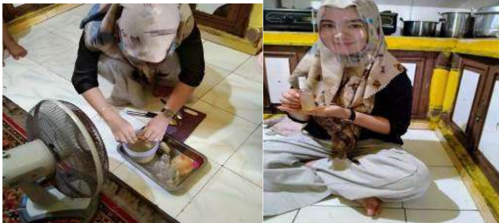
Gambar 4.6 Peserta Pelatihan Membuat Produk Hand Sanitizer Alami.

Pada hari ketiga kegiatan pelatihan, tim pengabdian kepada masyarakat kembali datang ke lokasi untuk melihat langsung kegiatan praktik yang dilakukan oleh peserta kegiatan. Setelah itu mereka diminta menunjukkan hasil produk hand sanitizer yang mereka buat. Ibu-ibu rumah tangga & remaja putri pun kemudian menunjukkan hasil praktik pembuatan hand sanitizer dari daun sirih dan jeruk nipis yang sudah mereka lakukan. Kegiatan tersebut bisa dilihat pada Gambar 4.6 berikut.