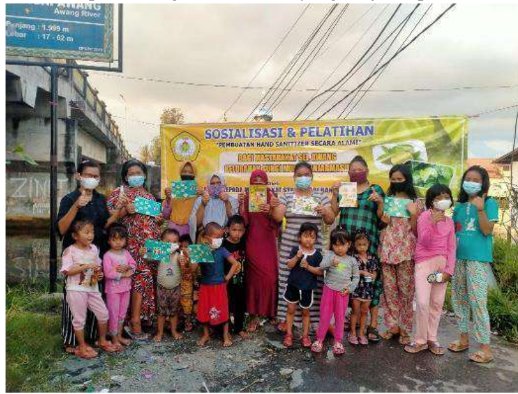
Gambar 2.1. Sasaran Kegiatan Pengabdian Kepada Masyarakat (PKM)

Sasaran kegiatan Pengabdian kepada Masyarakat ini adalah masyarakat RT.27 Gg. Sei. Awang Banjarmasin khususnya ibu-ibu rumah tangga & remaja puteri. Karena situasi pandemi Covid-19 tidak diizinkan untuk mengumpulkan masyarakat dalam jumlah banyak, maka peserta dibatasi untuk tidak lebih dari 30 orang. Ibu rumah tangga dan remaja putri yang menjadi sasaran kegiatan masih berada dalam usia yang produktif agar kegiatan ini dapat tepat sasaran. Berikut ini adalah foto dari peserta kegiatan PKM ini yang disajikan pada Gambar 2.1.