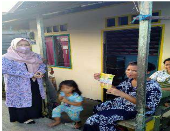
Gambar 1.4. Warga Berinteraksi di Luar Rumah Tanpa Menggunakan Masker

Dalam kehidupan sehari-hari masih banyak yang berinteraksi di luar rumah tanpa menjaga jarak dan mematuhi protokol kesehatan. Mereka juga ke luar rumah tanpa memakai masker seperti yang terlihat pada Gambar 1.4. Bahkan ada yang tidak tahu cara memakai masker yang benar. Kebiasaan seperti ini sangat berbahaya karena dapat membuat resiko terpaparnya virus covid-19 menjadi lebih tinggi. Oleh karena itu selain sosialisasi cara pembuatan hand sanitizer alami, maka juga dilakukan sosialisasi informasi tentang covid-19 dan protokol kesehatan.