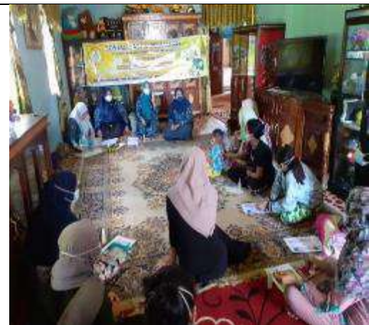
Gambar L7.8. Tim Pengabdian Membuka Kegiatan