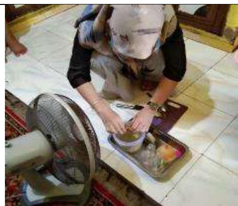
Gambar L7.18. Penambahan Air Jeruk Nipis pada Rebusan Daun Sirih