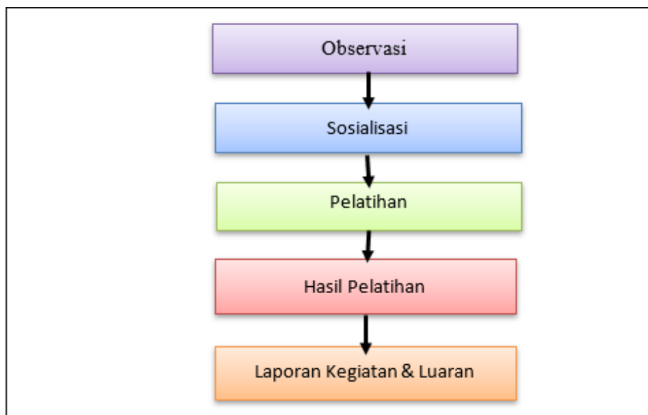
Gambar 2.2. Garis Besar Kegiatan

Bentuk kegiatan pengabdian kepada masyarakat (PKM) ialah berupa sosialisasi dan pelatihan. Adapun metode pelaksanaan kegiatan “Sosialisasi dan Pelatihan Pembuatan Hand Sanitizer Secara Alami dari Daun Sirih dan Jeruk Nipis Bagi Masyarakat Sei. Awang RT. 27 Kelurahan Surgi Mufti Banjarmasin” secara garis besar dapat dilihat dari diagram pada Gambar 2.2. berikut ini.