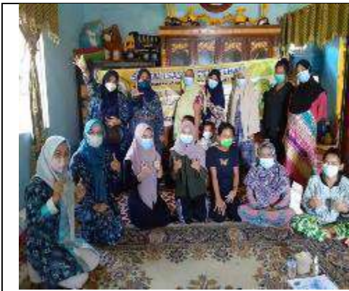
Gambar L7.13. Foto Bersama dengan Peserta Kegiatan Tetap Menggunakan Masker