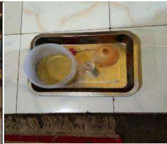
Gambar L7.16. Hasil Rebusan Daun Sirih