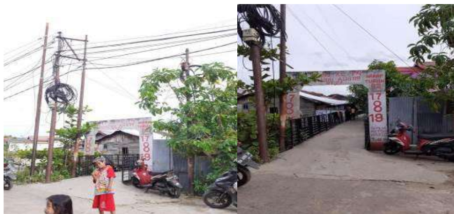
Gambar 1.3. Gang Sei. Awang sebagai Lokasi Kegiatan

Mitra PKM adalah warga Gang Sei. Awang yang terdiri dari ibu rumah tangga dan remaja putri. Jarak tempuh lokasi mitra sasaran dengan STKIP PGRI Banjarmasin memang tidak terlalu jauh. Namun daerah lokasi mitra kurang dikenal oleh warga Banjarmasin. Meski terletak di daerah perkotaan, namun cukup sulit menemukan lokasi mitra pada maps. Lokasi mitra berada tepat di samping jembatan Sungai Awang perbatasan antara Kelurahan Surgi Mufti & Kelurahan Sungai Andai. Terlihat rumah-rumah warga bersusun berderat di sepanjang sungai. Ada sekitar 20-30 kepala keluarga yang tinggal di sana dengan kondisi sosial ekonomi menengah ke bawah. Sehingga perlu dilakukan observasi dan kegiatan sosialisasi serta pelatihan agar lokasi mitra nantinya bisa lebih dikenal oleh warga Banjarmasin melalui luaran yang nantinya akan dihasilkan dari kegiatan PKM ini. Lokasi Gang Sei. Awang terletak di pinggiran Sei. Awang di bawah jembatan Sungai Andai yang fotonya ditampilkan pada Gambar 1.3.