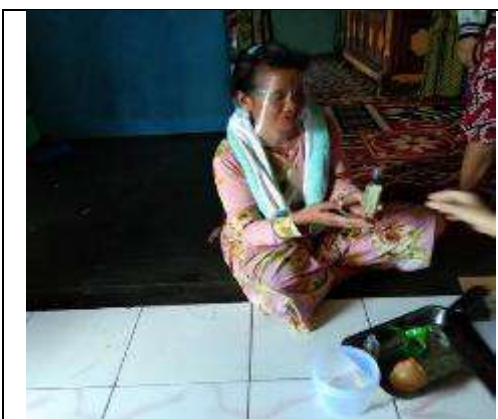
Gambar L7.21. Produk Hasil Praktik oleh Peserta Kegiatan