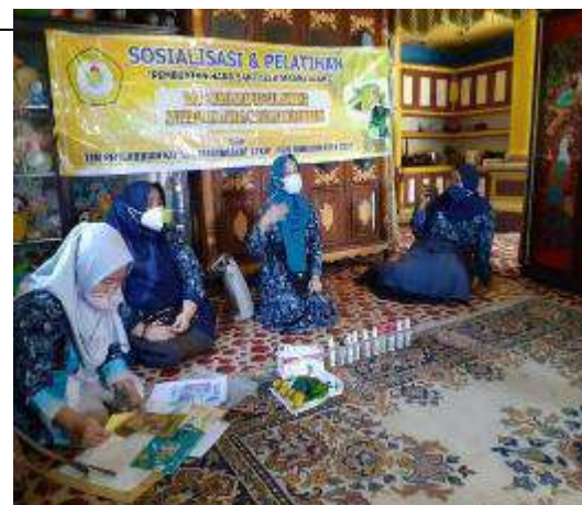
Gambar L7.10. Penyampaian Informasi Mengenai Adaptasi di Era New Normal dan Protokol Kesehatan