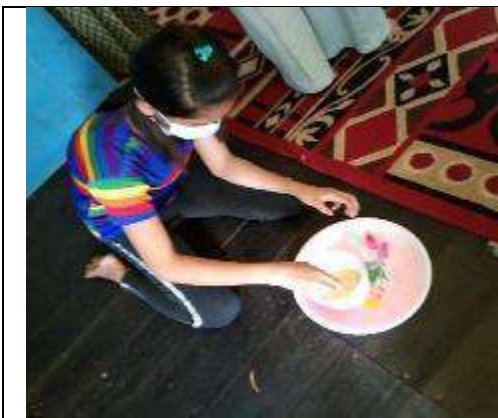
Gambar L7.19. Proses Pengadukan untuk Mencampur Air Jeruk Nipis pada Rebusan Daun Sirih