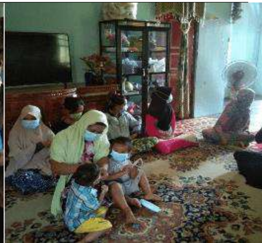
Gambar L7.2. Peserta Kegiatan Memasang Masker yang Diberikan