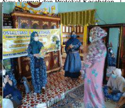
Gambar L7.12. Penyampaian Informasi Mengenai Contoh Produk Hand Sanitizer