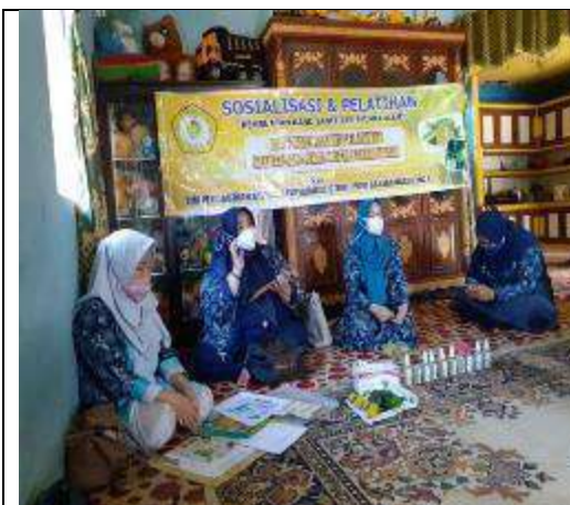
Gambar L7.9. Penyampaian Informasi Mengenai Seluk Beluk Covid-19