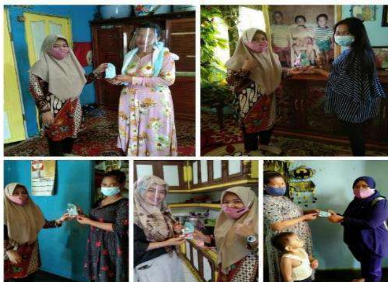
Gambar 4.7 Penyerahan Souvenir & Paket Kouta Internet

Tim pengabdian kepada masyarakat cukup senang dengan antusiasme para ibu-ibuni yang menunjukkan bahwa dalam situasi pandemi Covid-19 seperti ini mereka masih mau belajar bersama-sama untuk menerapkan protokol kesehatan dengan membuat alternatif bahan untuk dimanfaatkan sebagai pembunuh kuman. Sebagai wujud apresiasi atas antusiasme mereka, tim memberikan souvenir kepada peserta kegiatan yang bisa dilihat pada Gambar 4.7 berikut.