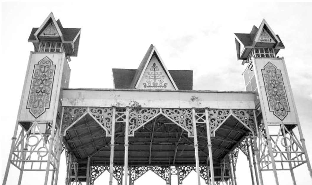
Gambar 2. Atap panggung pertunjukan di Stadion Sanaman Mantikei, Palangka Raya, yang didominasi ragam hias berbentuk sulur tanaman, Jata , dan Batang Garing.

Kebanyakan corak ragam hias Indonesia bertolak dari simbolisme spiritual tentang kekuatan semesta alam, kehidupan setelah mati, atau