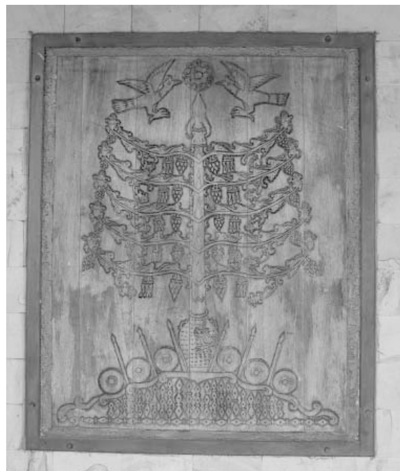
Gambar 1. Burung tingang (mengapit) dan Jata (pada belanga di pangkal pohon) dalam ragam hias Batang Garing.

Orang Dayak Ngaju percaya bahwa, meskipun mereka sekarang memeluk agama Islam, Kristen, atau pun Katolik, namun nenek moyang mereka adalah pemeluk kepercayaan Kaharingan. Tidak seperti kepercayaan Hindu Jawa, jarak historis yang memisahkan mereka dengan kepercayaan tersebut tidaklah jauh. Mudah dijumpai seorang Dayak Ngaju beragama Islam maupun Kristen, namun kakek