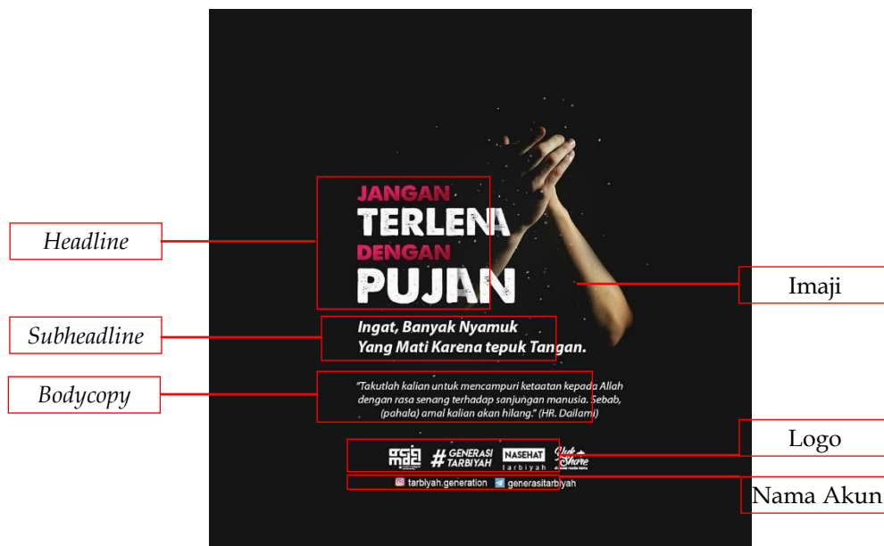
Gambar 2. Poster dakwah tema pujian

Pada level ketiga, yaitu legisign , dapat dipahami bahwa ini merupakan representasi dari kehidupan masyarakat kita—banyak di antara mereka yang tidak memiliki gaji tetap, tidak ada jumlah pendapatan pasti setiap bulan, namun dengan bekerja apa pun mereka tetap mendapatkan rezekinya untuk menghidupi diri dan keluarganya. Mereka yakin akan rezeki yang Allah berikan, kendati harus berdagang dengan modal kecil dan keterampilan ala kadarnya, sebagaimana janji Allah dalam ayat Al Quran yang tertera pada poster dakwah tersebut.