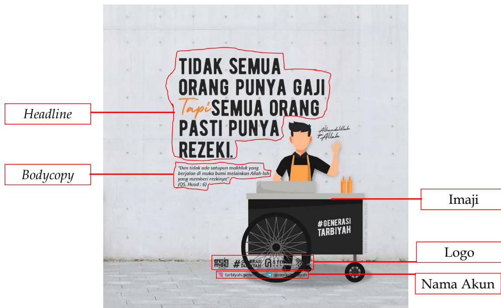
Gambar 1. Poster dakwah tema rezeki

Pada Gambar 1, imaji berupa gambar seorang pedagang keliling yang membawa dagangannya. Desainer memahami bahwa menggambar makhluk hidup dilarang oleh syariat Islam, sehingga bagian wajah tidak digambarkan. Rupa dan bentuk divisualisasikan oleh dinding dan jalanan yang mendukung imaji dengan warna natural dinding dan jalan. Rupa dan bentuk, serta warna juga diperlihatkan pada pengaturan tata letak teks dan mandatori agar memikat mata.