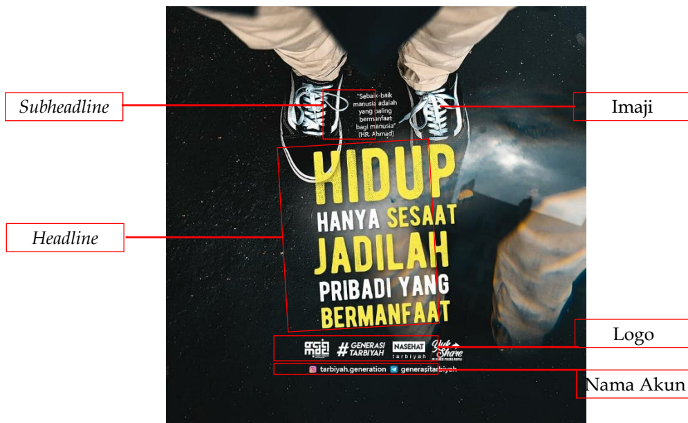
Gambar 3. Poster dakwah tema bermanfaat

Poster ini sebagai pengingat akan bahaya sanjungan dan pujian yang bisa membuat manusia khilaf dari ketaatan dan menjadi sombong. Sebuah nasihat dalam bentuk visual yang ditujukan untuk masyarakat Muslim secara luas. Bahkan aktif dalam kegiatan berdakwah pun tidak luput dari sanjungan dan pujian yang bisa membuat manusia lupa diri.