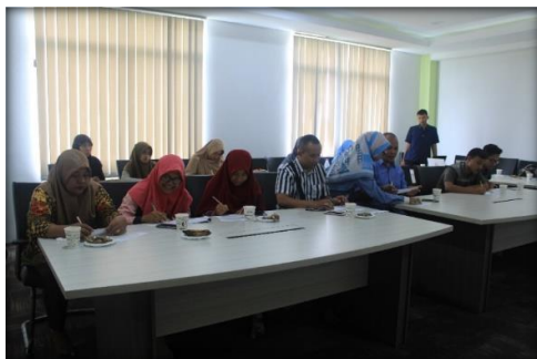
Gambar 2. Kegiatan pelaksanaan sosialisasi