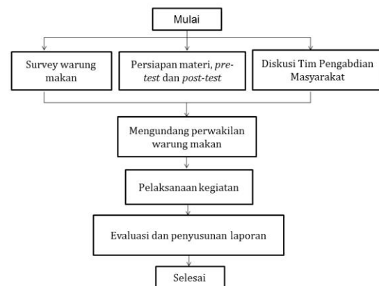
Gambar 1. Prosedur Pelaksanaan Pengabdian kepada Masyarakat

pelaksanaan kegiatan pengabdian kepada masyarakat ini.