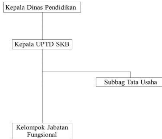
Gambar 2 Struktur Organisasi Sanggar Kegiatan Belajar (SKB) Kota Cimahi