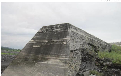
Dam Penanggul Sungai Rejali