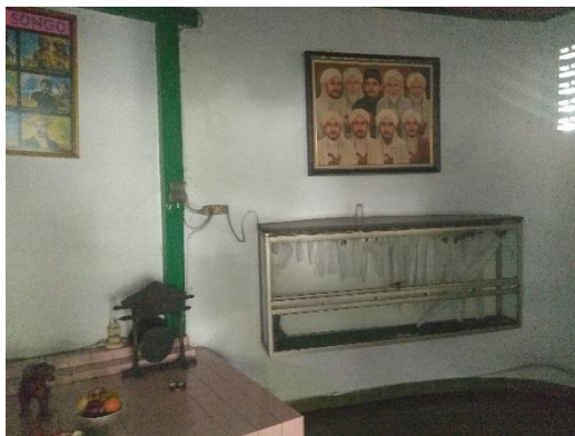
Gambar 3 bagian benda pusaka di ruang sesajen bagian kanan