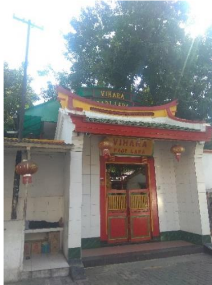
Gambar 1. Vihara Padi Lapa

Di ruang samping terdapat ruang pemujaan kepada patung dewa Dizangwang ( Tee Cong Ong Poo Sat ) yang menurut keterangan pengurus adalah dewa hakim, banyak orang yang percaya dewa tersebut adalah dewa penjaga pintu neraka. Patung dewa dalam posisi duduk memakai jubah sari berwarna kuning muda. Kepalanya tersemat mahkota yang diberi rumbai-rumbai yang menjuntai sampai ke badan, terbuat dari kain berwarna kuning. Di belakang ruang samping terdapat ruangan samping yang berfungsi sebagai gudang.