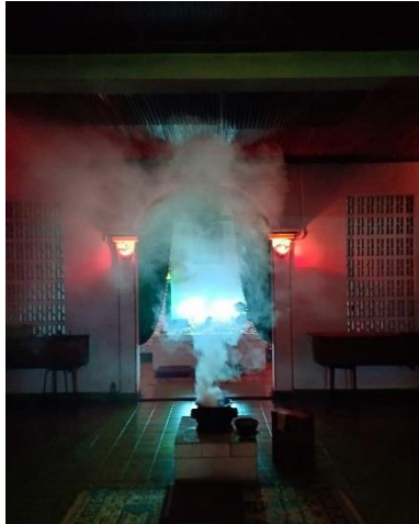
Gambar 5 bagian dalam tempat pemujaan wali sanga saat malam jumat

Pintu bangunan peribadatan di halaman belakang hanya buka di saat kamis malam. Mulai dari jam lima sore hingga tengah malam. Jamaat bersembahyang dengan membakar hio hitam. Hio hitam dikhususkan di tempat ini. Orang-orang yang mengurus kelenteng percaya tidak boleh ada hal yang berbau warna merah di bangunan ini. Setelah membakar hio juga ada pembakaran arang dan kemenyan untuk dibakar di tengah ruangan, posisi jamaat duduk di depan kendi. Lalu memberikan uang sesajen untuk arwah leluhur yang mendiami tempat itu. Setelah berdoa di tempat pemujaan wali sanga, jamaat yang ada saling bercengkrama satu sama lain mengobrol tentang berbagai hal di tempat duduk yang berada di koridor menuju bangunan tersebut. Pengurus juga menjamu jamaat-jamaat yang ada dengan makanan ringan dan kopi untuk menemani malam sembari berbincang-bincang.