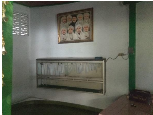
Gambar 2 bagian benda pusaka di ruang sesajen bagian kiri.

benda pusaka ini bentuknya bermacam-macam ada keris, rencong, hingga adapula yang bentuknya pentungan. Benda-benda pusaka didapatkan dari hasil sumbangan orang-orang.