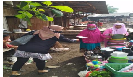
Gambar 3 Pembagian Masker di Pasar Tradisional