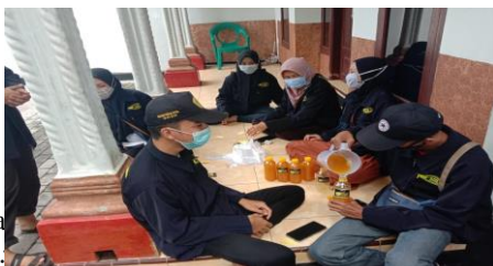
Jurnal Abdi Panca Marga Masyarakat https://doi.org/10.30605/abdi-panca-marga.v2i2.11

Banyak cara untuk menjaga daya tahan tubuh agar bisa tetap sehat di saat pandemi seperti saat ini. Sebagai salah satu upaya untuk meningkatkan imun tubuh, salah satunya adalah membuat minuman herbal dari tanaman toga. Selain bahan-bahannya mudah didapatkan, minuman herbal (sinom) juga bisa dibuat sendiri di rumah, sehingga bisa dikonsumsi sehari-hari.