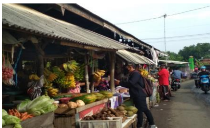
Gambar 2 Pembagian Masker di Pasar Buah

Kegiatan pembagian masker kepada pedagang pasar dan masyarakat, dikarenakan kurangnya kesadaran diri akan pentingnya pemakaian masker. Kegiatan pembagian masker dilakukan kepada pedagang pasar Piyeng, pasar buah Mastrip dan masyarakat sekitarnya, sebagai upaya untuk mengurangi penyebaran virus Covid-19. Sebanyak 25 masker telah dibagikan kepada masyarakat tersebut.