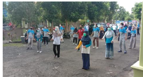
Gambar 4 Kegiatan Senam Bersama

Munculnya wabah penyakit Covid-19 mendorong pentingnya untuk memberikan edukasi dan penyadartahuan pentingnya pola hidup bersih dan sehat. Masyarakat perlu diberikan pengetahuan mengenai penularan dan cara pencegahan Covid-19, agar penyebarannya bisa ditekan. (Sulaeman dan Supriadi, 2020) Edukasi penerapan pola hidup sehat di kecamatan Kedopok yang kami lakukan adalah melakukan kegiatan bersih-bersih dan senam sehat. Diharapkan hal ini dapat meningkatkan imunitas tubuh masyarakat Kecamatan Kedopok dan sekitarnya. Pada kesempatan ini pula dibagikan sebanyak 50 stiker edukasi pola hidup sehat kepada masyarakat berikut pemasangan banner edukasi sebanyak 2 banner, pada saat pelaksanaan kegiatan senam dan bersih-bersih.