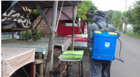
Gambar 5 Penyemprotan Disinfektan

cairan disinfektan telah disediakan untuk pelaksanaannya.