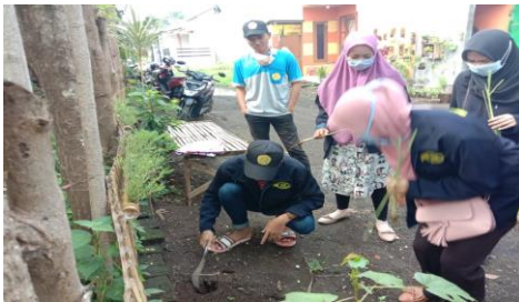
Gambar 6 Penanaman Tanaman Toga

Penanaman tanaman toga memberikan banyak keuntungan, dan juga memberikan khasiat sebagai obat. Masih banyak orang yang menggunakan obat tradisional untuk menyembuhkan beberapa jenis penyakit. Salah satu kegiatan yang dapat menunjang keperluan ini adalah dengan menanam tanaman obat keluarga di lingkungan tempat tinggalnya.