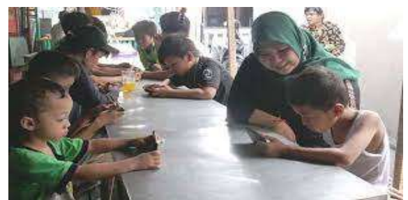
Gambar 1. Penggunaan gadget pada anak