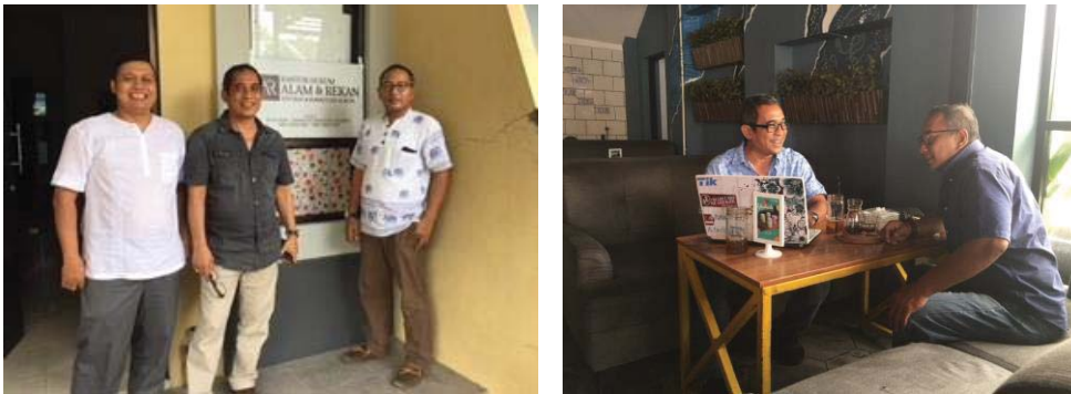
Gambar 5. Sosialisasi dan pelatihan penggunaan aplikasi Virlo pada Kantor Hukum Alam & Rekan