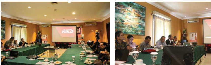
Gambar 1. Pelaksanaan FGD Virtual Law Office (Virlo)

Alasan penunjukan mitra dengan pertimbangan bahwa pada ke 2 (dua) kantor hukum tersebut masih belum mengoptimalkan penggunaan system informasi dan mereka menganggap belum menjadi kebutuhan dalam memberikan layanan jasa hukum. Penggunaan teknologi informasi rata-rata hanya sebatas penggunaan web site sebagai wahana komunikasi dan promosi yang menampilkan profile kantor, profile lawyer dan bidang layanan jasa hukum serta referensi klien yang pernah ditanganinya.