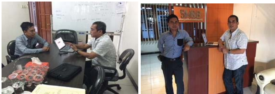
Gambar 4. Sosialisasi dan pelatihan penggunaan aplikasi Virlo pada SM&B Law Office

Sosialisasi dan pelatihan penggunaan aplikasi VIRLO pada kedua mitra dilaksanakan secara intensif selama satu bulan. Hasil yang diperoleh dengan pelatihan penggunaan aplikasi VIRLO memberikan manfaat terhadap kecepatan dan efisiensi kantor hukum mitra dalam memberikan layanan jasa hukum. Dengan demikian pengembangan legal process melalui pemanfaatan layanan jasa hukum berbasis teknologi informasi diharapkan semakin meningkatkan bentuk layanan jasa hukum dari mitra yang selama ini dilakukan secara konvensional, seperti terlihat pada gambar 4 dan gambar 5 di bawah ini