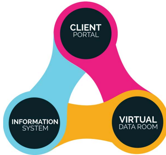
Gambar 3. Model Pengembangan Sistem Informasi Kantor Hukum.

Dari ketiga hal pokok untuk proses layanan jasa hukum virtual (gambar 3), penulis lebih cenderung menggunakan terminologi Client Portal , Information System dan Virtual Data Room sebagaimana tiga hal yang dikembangkan Virlo. (Budi Endarto : 2017)