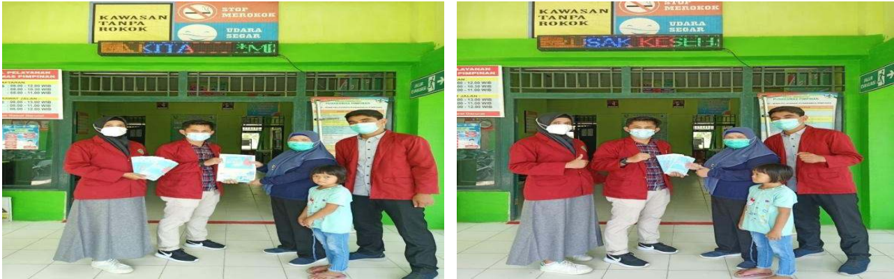
Gambar 4. Peyerahan Leafleat dan brosur kepada Puskesmas Pimpinan

Kegiatan penyuluhan tentang Penyakit Hipertensi di Puskesmas Pimpinan sangat penting dilakukan sebagai upaya untuk meningkatkan pengetahuan pengunjung tentang penyakit hipertensi. Hasil kegiatan pengabdian yang dilakukan oleh tim sejalan dengan beberapa kegiatan pengabdian berupa penyuluhan kesehatan tentang penyakit hipertensi yang menunjukkan adanya peningkatan pengetahuan tentang pencegahan penyakit hipertensi (Sofiana, et al., 2018; Isnaini dan Purwito, 2019; Mahadewi, et al., 2021). Penyuluhan kesehatan tentang penyakit hipertensi diperlukan sebagai upaya pencegahan dari penyakit hipertensi. Kesadaran untuk pencegahan penyakit hipertensi ini masih rendah hal ini Didukung dengan evidence based penelitian yang sudah dilakukan terkait dengan metode penyuluhan efektif dalam meningkatkan pengetahuan kelompok sasaran.