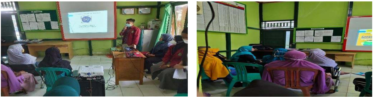
Gambar 2. Kegiatan Penyuluhan Kesehatan

Selanjutnya adalah kegiatan penyuluhan Kesehatan tentang hipertensi dan cara pencegahannya dengan media audiovisual sesuai dengan kesepakatan waktu yang ditetapkan pada koordinasi tahap awal. Sebelum kegiatan penyuluhan Kesehatan dilakukan maka peserta diberikan kuesioner pretest untuk mengukur pengetahuan awal sasaran sebelum dilakukan kegiatan penyuluhan Kesehatan.