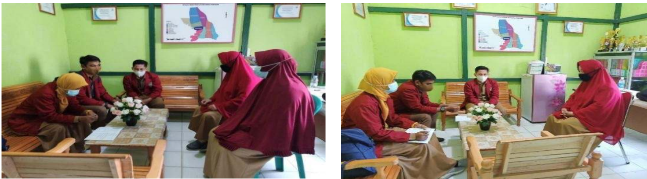
Gambar 1. Koordinasi dengan pihak Puskesmas

Peserta kegiatan penyuluhan ini adalah pengunjung Puskesmas Pimpinan. Berikut ini adalah dokumentasi tahapan kegiatan penyuluhan yang sudah dilaksanakan.