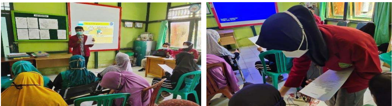
Gambar 3. Pembagian Pre-test/Post-test

Selanjutnya adalah kegiatan penyuluhan Kesehatan tentang hipertensi dan cara pencegahannya dengan media audiovisual sesuai dengan kesepakatan waktu yang ditetapkan pada koordinasi tahap awal. Sebelum kegiatan penyuluhan Kesehatan dilakukan maka peserta diberikan kuesioner pretest untuk mengukur pengetahuan awal sasaran sebelum dilakukan kegiatan penyuluhan Kesehatan.