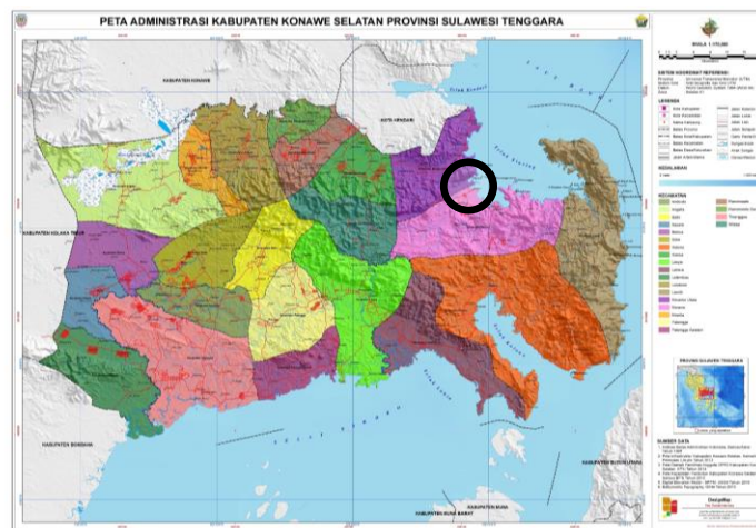
Gambar 1. Peta Lokasi Pengabdian Masyarakat di Desa Mata Wawatu Kabupaten Konawe Selatan

Bimbingan teknis penyusunan master plan penataan permukiman Desa Mata Wawatu Kecamatan Moramo Utara Kabupaten Konawe Selatan telah dilaksanakan sejak setelah penandatanganan Surat Perjanjian Pelaksanaan Pengabdian Program Kemitraan Masyarakat Internal Universitas Halu Oleo Tahun Anggaran 2021 tanggal 16 Juli 2021. Rangkaian kegiatan dimulai tanggal 02 Agustus 2021 saat koordinasi awal kegiatan, sosialisasi, bimbingan dan pendampingan Teknis di lapangan saat melakukan survei, FGD dan penyusunan Master Plan Desa Mata Wawatu hingga tanggal 25 Oktober 2021. Keseluruhan kegiatan dilaksanakan di Gedung Balai Desa Mata Wawatu (lihat Gambar 1).