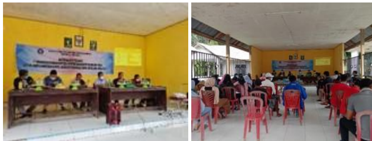
Gambar 2. Sosialisasi dan Pelatihan Penyusunan Master Plan Desa

Kegiatan pretest terdiri atas dua sesi dan masing-masing sesi terdiri atas beberapa soal dengan bahasa sederhana yang mudah dipahami oleh warga masyarakat peserta pelatihan. Sesi satu membahas tentang pemberian pemahaman terkait materi master plan desa, kegunaan master plan desa dalam perencanaan pembangunan desa serta tata cara penyusunan master plan . Metode pengisian dengan memilih pilihan ganda dan essay menulis pemahaman tanggapan dan harapan terkait dengan penyusunan master plan desa. Sesi dua terkait dengan teknik survey dan pemetaan wilayah desa, metode pengisiannya sama dengan metode sesi satu yaitu dengan memilih pilihan ganda dan essay menuliskan pemahaman tanggapan terkait dengan cara melakukan survei dan pemetaan wilayah desa.