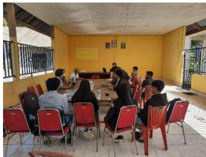
Gambar 5. Kegiatan pendampingan teknis dalam FGD masyarakat Desa Mata Wawatu

Setelah kegiatan kompilasi dan analisis data secara partisipatif dilakukan, maka perlu dilaksanakan diskusi terarah melalui kegiatan FGD dengan warga masyarakat Desa Mata Wawatu lainnya. Kegiatan FGD dilaksanakan pada tanggal 25 Oktober 2021 bertempat di ruang Balai Desa Mata Wawatu. Tujuan kegiatan ini adalah untuk memaparkan data hasil observasi lapangan yang dilakukan oleh masyarakat secara swadaya Bersama Tim PKM dan mahasiswa. Kegiatan ini dihadiri langsung oleh kepala Desa Mata Wawatu, ketua BPD Mata Wawatu, ketua LPM Desa Mata Wawatu, tokoh masyarakat, Kader PKK dan Posyandu, tim pendamping desa, warga masyarakat lainnya, tim PKM dan mahasiswa.