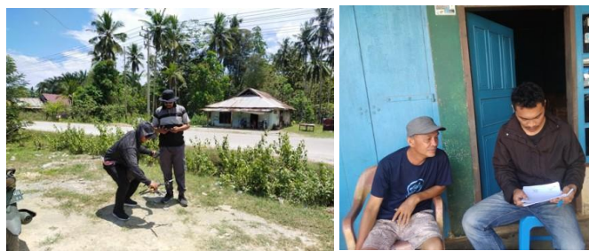
Gambar 3. Pendampingan teknis Survei dan Pemetaan Wilayah Desa Mata Wawatu bersama dengan mahasiswa

Kegiatan survei dan pemetaan wilayah dilaksanakan mulai tanggal 8 September 2021 sampai dengan 20 Oktober 2021. Kegiatan survei dilaksanakan oleh masyarakat bersama dengan mahasiswa kerja praktek dari Jurusan Arsitektur Fakultas Teknik UHO dan tim PKM UHO. Kegiatan ini bertujuan untuk mengidentifikasi potensi dan permasalahan wilayah desa yang akan dijabarkan dalam dokumen master plan desa dalam bentuk indikasi program.