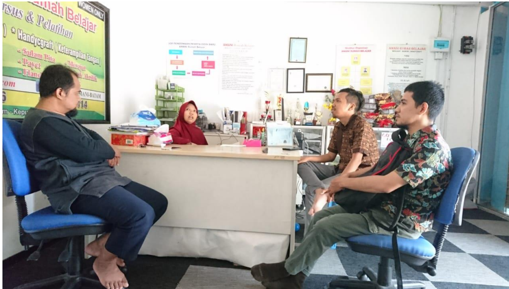
Gambar 1. Proses Melakukan Persiapan dan Peserta Pengabdian

oleh penggunaan teknologi informasi yang sesuai. Modal operasional antara lain untuk pengadaan bahan baku, upah tenaga kerja, dan biaya operasional sebagian sudah cukup tersedia dengan baik. Akan tetapi dalam manajemen orderan dan pembuatan masih dilakukan secara manual, oleh karena itu dalam menjalankan usaha tanpa ada sentuhan teknologi informasi akan sangat lambat perkembangannya dan juga tidak mampu menjawab tantangan global. Sehingga cara demikian hanya mampu untuk bertahan dalam ruang lingkup lokal saja belum bisa mencangkup secara nasional. Juga dalam proses perancangan busana yang dibuat belum menggunakan software designer namun masih menggunakan proses manual. Para peserta dari masing – masing Mitra juga dibantu dalam pendaftaran FB Ads untuk dapat melakukan pemasaran melalui internet marketing.