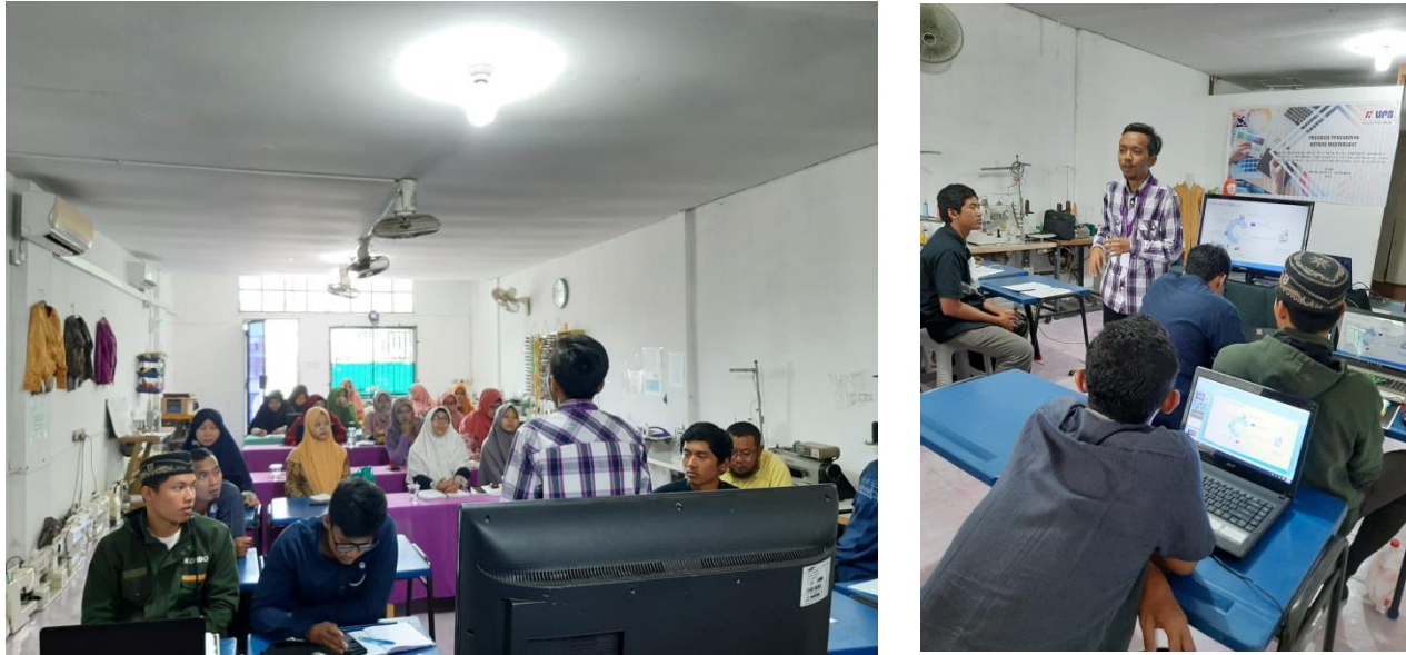
Gambar 2. Pengarahan dan Sosialisasi Perkembangan Teknologi Informasi

Hari Selanjutnya para peserta sudah mempersiapkan komputer / laptop guna mendukung kegiatan teknologi informasi yang dilakukan bersama para tim pengabdian. Adapun software yang sudah dipersiapkan untuk desain dan kebutuhan CAD designer yaitu, Adobe Photoshop, Illusator, CorelDraw dan Marvelous Design. Para peserta antusias dalam menjalankan pelatihan dan sudah ada juga yang memiliki bisnis selain bisnis garment. Sehingga peserta dapat melakukan praktek sesuai dengan bidang yang digelutinya. Beberapa hasil dari pelatihan seperti gambar dibawah ini: