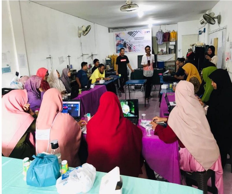
Gambar 4. Suasana Pelatihan