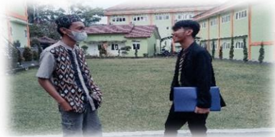
Ket Gambar : Wawancara dengan mudir dan kesartrian Abi Ummi boyolali