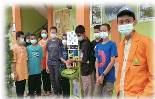
Ket Gambar : Membangun kesadaran mencuci tangan

tempat umum yang tersebar di seluruh lingkungan pesantren, selain itu alat di atas juga sudah dilengkapi dengan sabun cuci tangan. Namun realitanya masih banyak santri yang tidak melakukan cuci tangan disebabkan ketidaktahuan sehingga dikalangan mereka pun jadi terasa asing. Maka mesti membangun kesadaran bersama terkait pembudayaan cuci tangan menggunakan sabun di air yang mengalir, supaya menjadi bagian high personal untuk menanggulangi serta mencegah penularan Covid1(10).