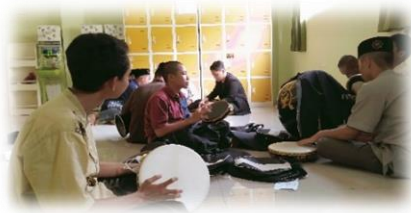
Ket Gambar : wirid/ doa bersama dan rebana/hadhroh