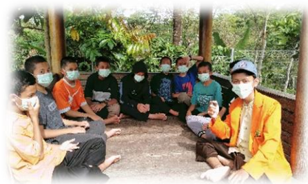
Ket Gambar : Penertiban memakai masker

sering lagi dalam mengingatkan, atau bisa juga hukum fisik di tempat dan selainnya atau bisa juga diberlakukan denda secara langsung bagi yang ketahuan tidak memakai masker.