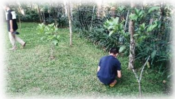
Ket Gambar : Membersihkan lingkungan pesantren