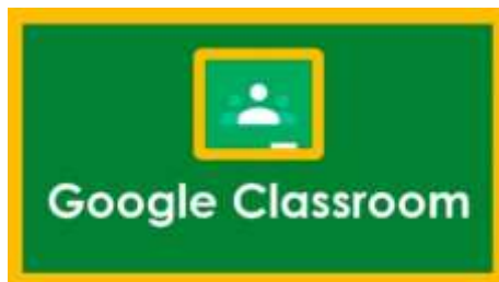
Gambar 1. Fitur Awal Ketika Masuk Google classroom

Pintu awal masuk ke google classroom , fitur ini akan muncul apabila telah diprogramkan boleh melalui email atau melalui google sendiri.