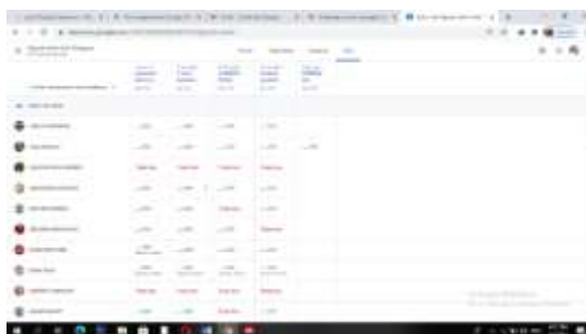
Gambar 3. Nilai

Google classroom mendukung banyak cara penilaian yang berbeda. Guru memiliki opsi untuk memantau kemajuan setiap siswa pada tugas di mana mereka dapat membuat komentar dan mengedit. Tugas yang diubah dapat dinilai oleh guru dan dikembalikan dengan komentar untuk memungkinkan siswa merevisi tugas dan dikembalikan. Setelah dinilai, tugas hanya dapat diedit oleh guru kecuali guru mengembalikan tugas. Seperti gambar 3