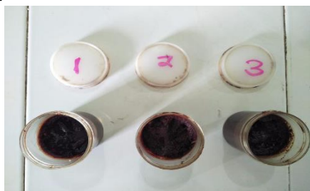
Gambar 2. Formulasi Krim Ekstrak Etanol Bawang Dayak

lebih mudah diaplikasikan dibandingkan dengan tipe A/M.