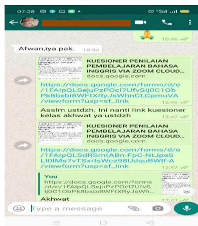
Gambar 7. Penyebaran Kuesioner Kepuasan Siswa

Adapun kuesioner ini memiliki 7 pernyataan. Hasil respons yang diberikan oleh siswa dapat dilihat sebagai berikut.