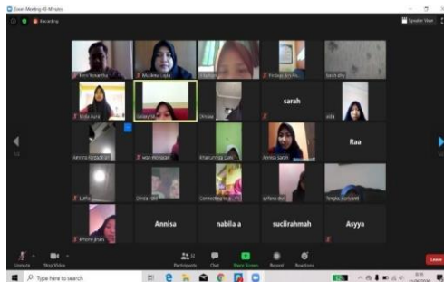
Gambar 4. Pertemuan Pertama Pembelajaran Bahasa Inggris Menggunakan Aplikasi Zoom Clouds Meeting

host Zoom Clouds Meeting membantu guru meng- invite seluruh peserta didik yang terlibat. Pada pertemuan kedua, guru Bahasa Inggris telah secara aktif menjadi host pada kelas daringnya.