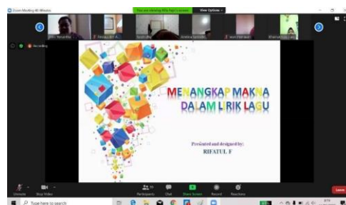
Gambar 5. Pertemuan Kedua dimana Guru menjadi Host Mandiri menggunakan aplikasi Zoom Clouds Meeting pada kelas Akhwat