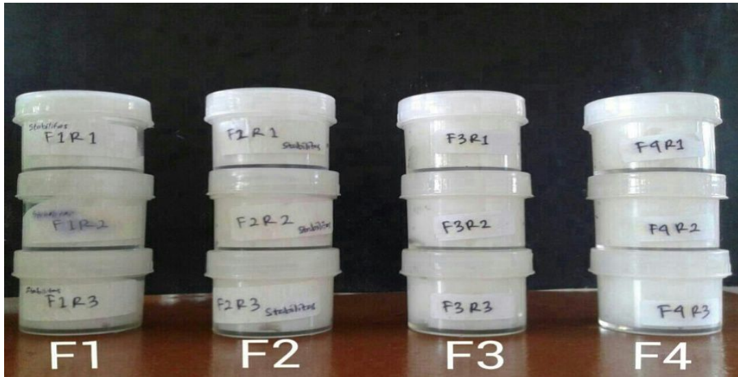
Gambar 1. Basis emulgel (F1) konsentrasi Carbopol 0,5% dan TEA 1%, basis emulgel (F2) konsentrasi Carbopol 1% dan TEA 1,5%, basis emulgel konsentrasi (F3) Carbopol 1,5% dan TEA 2%, basis emulgel konsentrasi (F4) Carbopol 2% dan TEA 2,5%

Berdasarkan hasil tersebut, keempat formula basis memperlihatkan penampilan yang hampir sama secara visual, homogen dengan tipe emulsi M/A serta stabil berdasarkan uji freeze thaw . Secara organoleptis, F1 berbentuk massa emulgel agak encer, F2 berbentuk massa emulgel, F3 berbentuk massa emulgel agak kental, F4 berbentuk massa emulgel kental.