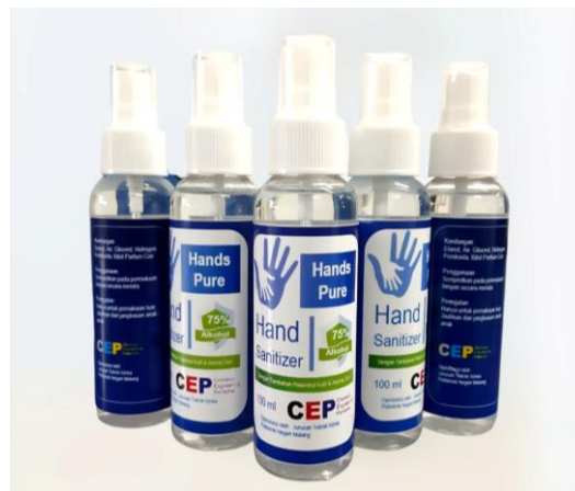
Gambar 5. Produk hand sanitizer yang dihasilkan

Dalam setiap tahap kegiatan ini peserta diberikan kesempatan untuk bertanya akan segala sesuatu yang berkaitan tentang proses produksi handsanitizer. Secara umum pelaksanaan PkM ini berjalan dengan lancar tanpa adanya kendala, dikarenakan kerjasama yang baik antara Rukun Warga (RW) setempat yang memberikan dukungan dalam penyediaan tempat balai RW sebagai tempat pelaksanaan kegiatan dan peserta memiliki motivasi yang tinggi dalam mengikuti setiap tahapan pelatihan.