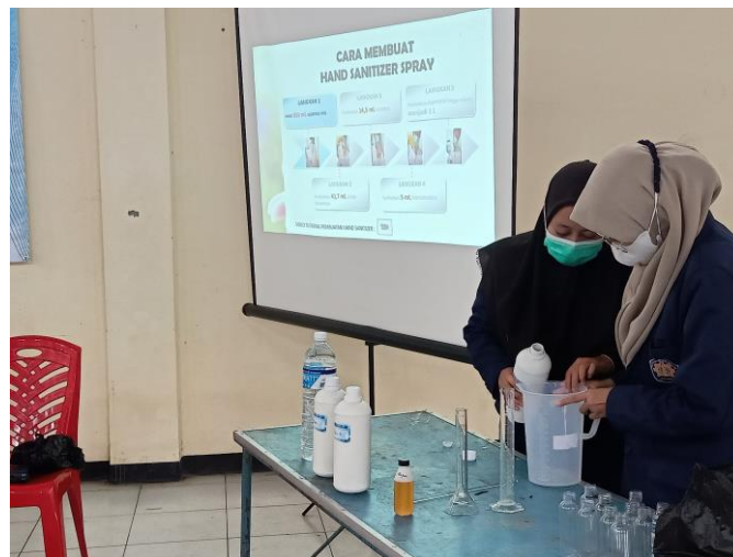
Gambar 3. Mahasiswa mempraktikkan bagaimana cara membuat handsanitizer secara langsung dengan alat – alat sederhana yang bsai dijumpai di Rumah.

Sebagai tahap persiapan, pembuatan sampel Hand sanitizer juga dilakukan sebagai contoh produk untuk Kader Posyandu Kelurahan Tasikmadu. Pembuatan sampel produk dilakukan oleh mahasiswa Jurusan Teknik Kimia Politeknik Negeri Malang di laboratorium yang tersedia di kampus. Pelaksanaan kegiatan Pengabdian kepada Masyarakat dilakukan secara luring bersama Kader Posyandu Kelurahan Tasikmadu dibantu dengan 2 mahasiswa dari Jurusan Teknik Kimia Politeknik Negeri Malang untuk memberikan pendampingan saat kegiatan demo pembuatan hand sanitizer oleh peserta pelatihan.