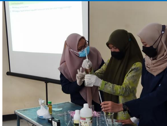
Gambar 4. Peserta melakukan praktek secara langsung membuat handsanitizer dipandu oleh mahasiswa