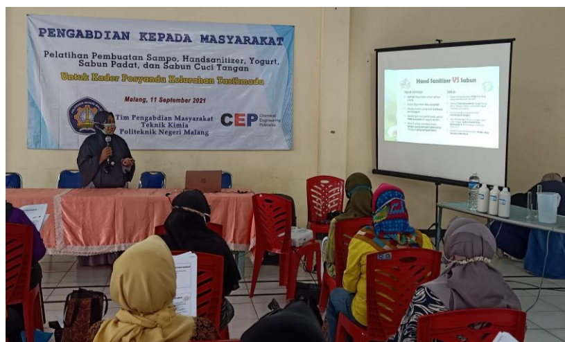
Gambar 2. Penjelasan pentingnya Handsanitizer dan bagaimana cara membuatnya oleh Tim PkM

Persiapan lain terkait pelaksanaan yaitu perhitungan resep dalam produksi pembuatan hand sanitizer air, serta pengadaan bahan untuk proses produksi. Penyusunan modul dan pembuatan video mengenai prosedur dari pembuatan hand sanitizer disusun untuk memudahkan Kader Posyandu Kelurahan Tasikmadu memahami proses pembuatan hand sanitizer [10]. Modul dan video yang telah dibuat akan disampaikan kepada pengurus Kader Posyandu Kelurahan Tasikmadu melalui perwakilan dari kelompok PkM. Prosedur pembuatan hand sanitizer juga akan dijelaskan atau dipaparkan kembali pada saat pelaksanaan kegiatan PkM secara luring (gambar 2).