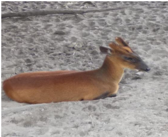
Gambar 2. Pelanduk / kancil