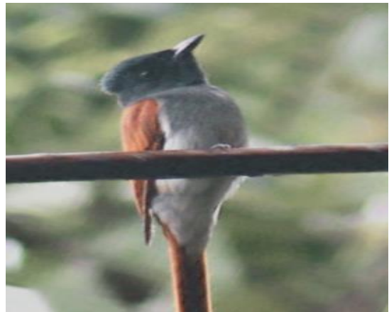
Gambar 4. Burung nera bencong / burung seriwang Asia