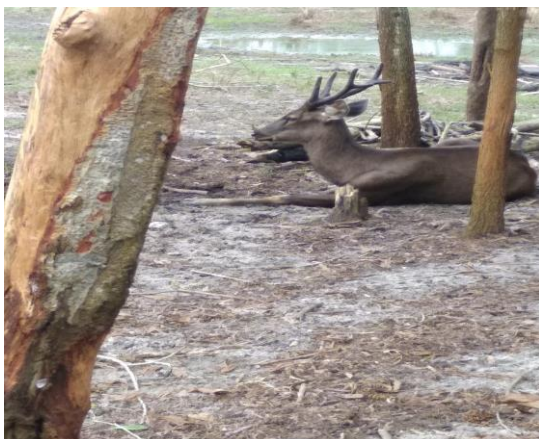
Gambar 3. Kijang