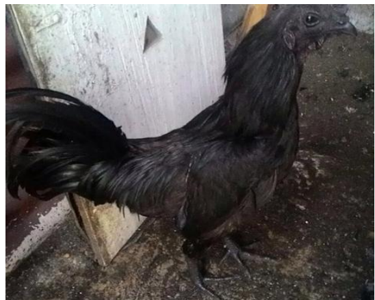
Gambar 5. Ayam hitam / ayam cemani