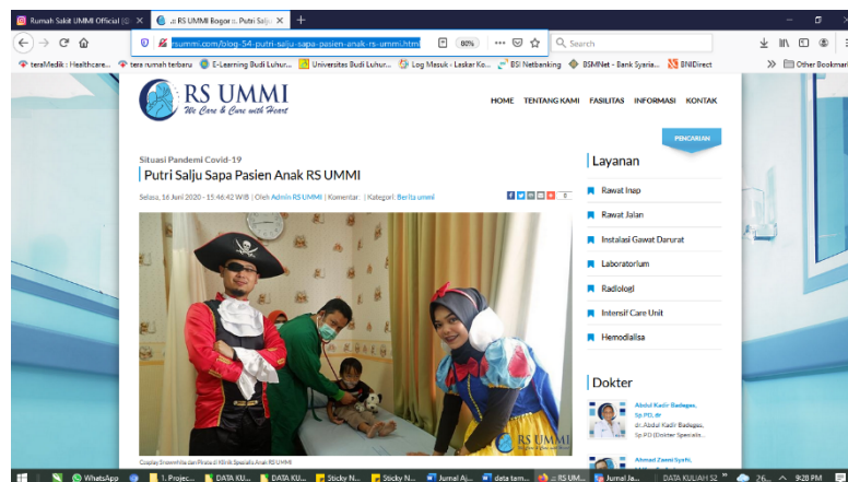
Gambar 3. contoh tampilan landing page web RS UMMI

(5) Pemasaran langsung ( direct marketing ). Pemasaran langsung di RS UMMI melalui tim divisi pemasaran dan pengembangan bisnis. Mereka memberikan surat penawaran, langsung ke perusahaan-perusahaan yang memiliki potensi untuk meningkatkan pendapatan sales.