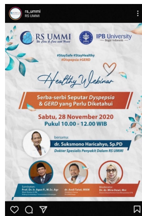
Gambar 1. Health Talk

masa pandemi, diantaranya pemasaran secara langsung ke perusahaan-perusahaan dengan memberikan penawaran pelayanan kesehatan, juga memberikan informasi kepada pasien maupun calon pasien bahwa RS UMMI itu aman untuk dikunjungi, dan pelayanan kesehatan pun masih dapat dilakukan secara langsung di rumah sakit tanpa perlu rasa khawatir yang berlebihan. Selain itu juga melakukan penawaran langsung ke perusahaan,serta memanfaatkan platfrom digital seperti zoom , google meet , dan youtube sebagai media sarana untuk penyembaran infromasi. Salah satunya adalah program “Health Talk - Webinar” yang semasa pademi ini dilakukan secara berkala dan gratis, dengan menghadikan dokter-dokter spesialis dari RS UMMI sebagai pembicara.