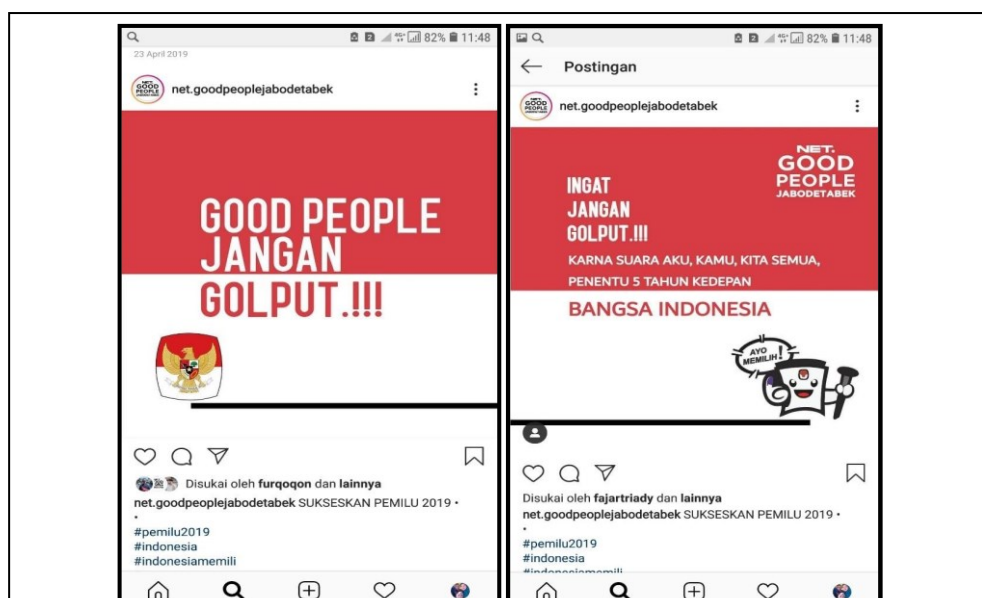
Gambar 1 dan Gambar 2: Wacana politik komunitas NET.Good People Jabodetabek