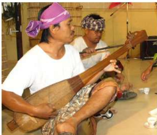
Thin shaped Gambus Biawak lute (Beaufort, Sabah).

Gambus Melayu tampaknya adalah jenis gambus yang populasinya paling banyak tersebar di Nusantara. Persebarannya diberbagai wilayah membuat ia memiliki banyak nama lokal. antara lain, gambus lunik , gambus buha , gambus lappung (Lampung) (Irawan, 2008; Hastanto; Kartomi), gambusi / kacapi (Pulukadang, 2007:80). Sementara itu di Malaysia dan Brunei Darussalam gambus semacam ini disebut gambus seludang , gambus biawak , gambus Hijaz (Hilarian, 2005:66-67). Juga perlu disebutkan di sini gambus Melayu juga dikenal dengan nama gambus zapin . Hal ini sebabkan alat musik petik ini digunakan sebagai pengiring tarian zapin .