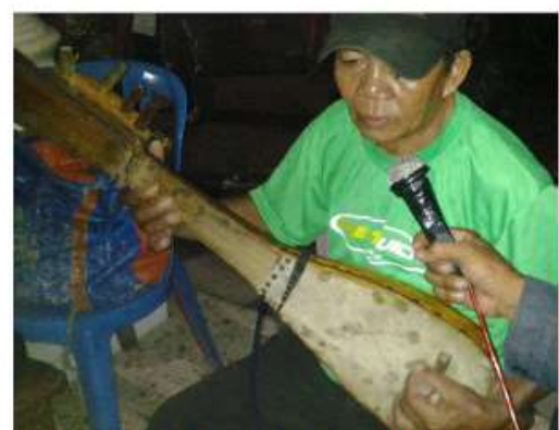
Gambus lute of the folklorical troupe Kobi Tallua (Makasar, SW Sulawesi).