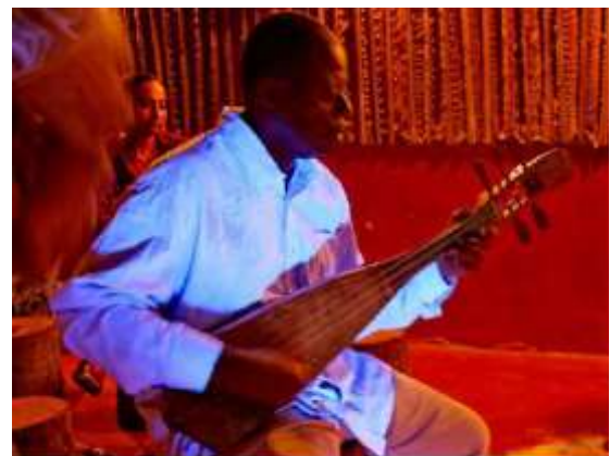
Gambar 4: gabusi (Swahili/ Comoros)

Sumber: https://al-bab.com/albab-org/albab/bys/articles/mokrani11.htm