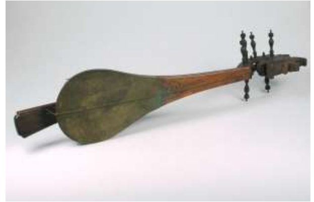
Gambar 2: qanbus koleksi Tropen Museum .

https://commons.wikimedia.org/wiki/File:Qanbuz.JPG