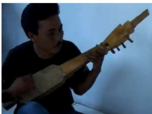
That typical sulawenese design borrowed from the local Kecapi