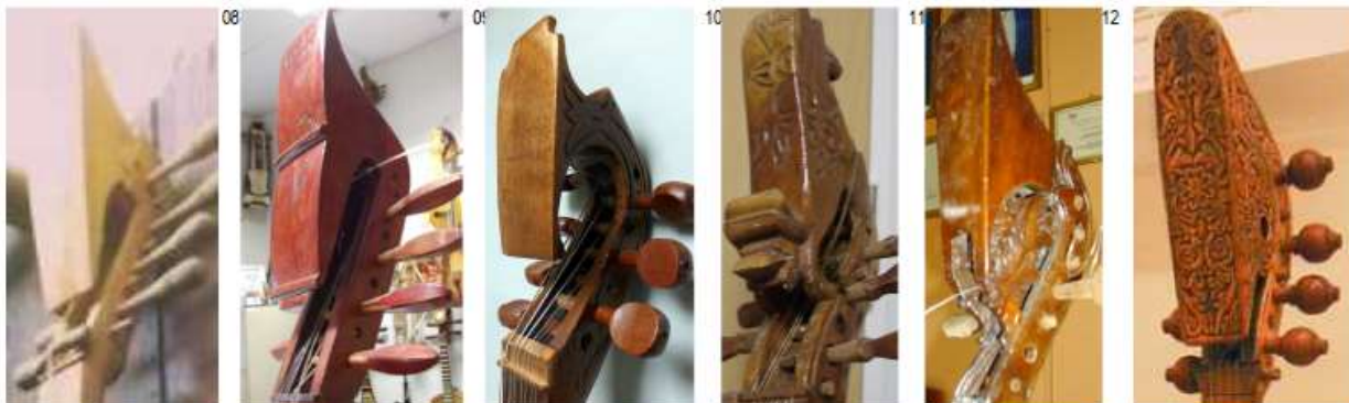
Variations on the deco pattern of the naga , ITEM n°07 (Tanjung Batu, Riau Isl), n° 09 (Johore Baru, Malaysia), n°10 (Sumatra) n°08 & 11 by BIN OSMAN (Batu Pahat, Malaysia), n°12 (Malaysia)