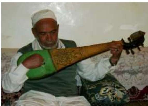
Gambar 3: qanbus (Yaman)