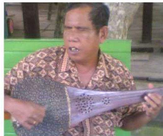
Thin shaped Panting lute (Teggenrung, eastern Kalimantan). Outlet are drilled in the fingerboard. Snake skin made resonator.