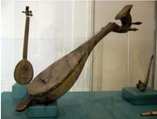
Gambar 1: qanbus koleksi Kunsthistorisches Museum , Vienna

gambus Arab ( oud/ ud ) dengan ukuran yang lebih besar dan konstruksi organologis yang juga berbeda. Berikut dibahas dua alat gambus yang dimaksud.