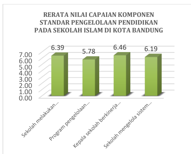
Gambar 4. Grafik Rerata Nilai Capaian Komponen standar pengelolaan pada sekolah Islam di Kota Bandung

Berikut adalah grafik yang menyajikan rerata nilai capaian setiap komponen dan indikator pada standar pengelolaan berdasarkan rapor mutu tahun 2020, yang terdiri dari 4 komponen yaitu (1) sekolah melakukan perencanaan pengelolaan, (2) program pengelolaan dilaksanakan sesuai ketentuan, (3) kepala sekolah berkinerja baik dalam melaksanakan tugas kepemimpinan dan (4) sekolah mengelola sistem informasi manajemen.