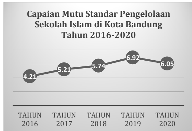
Gambar 1. Grafik Capaian Mutu Standar pengelolaan Sekolah Islam di Kota Bandung Tahun 2016-2020

Gambar diatas menunjukkan rerata nilai capaian standar pengelolaan sekolah Islam jenjang dasar dan menengah di Kota Bandung pada 4 tahun terakhir cenderung mengalami peningkatan terutama pada tahun 2019, ini merupakan salah satu implikasi dari implementasi kebijakan sistem penjaminan mutu pendidikan melalui penerapan SPMI di setiap pendidikan dasar dan menengah. Sedangkan pada tahun 2020 mengalami penurunan 0,87, salah satu factor penyebabnya adalah terjadinya pandemic covid 19 yang sangat signifikan berpengaruh pada kualitas pendidikan, termasuk pemenuhan standar pengelolaan pendidikan di satuan pendidikan dasar dan menengah.