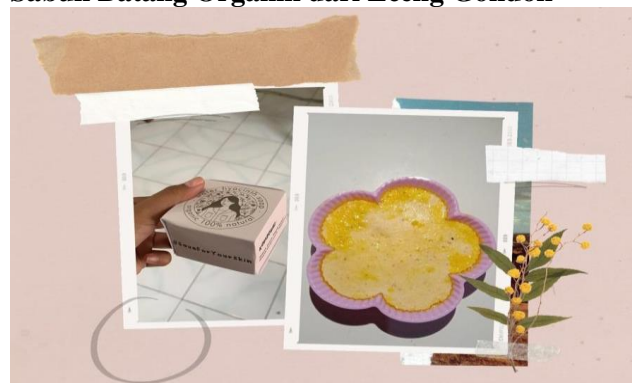
Gambar 3: Produk Sabun Batang Organik