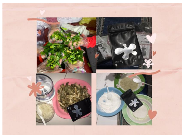
Gambar 2: Proses Pembuatan Produk Masker Kecantikan Organik