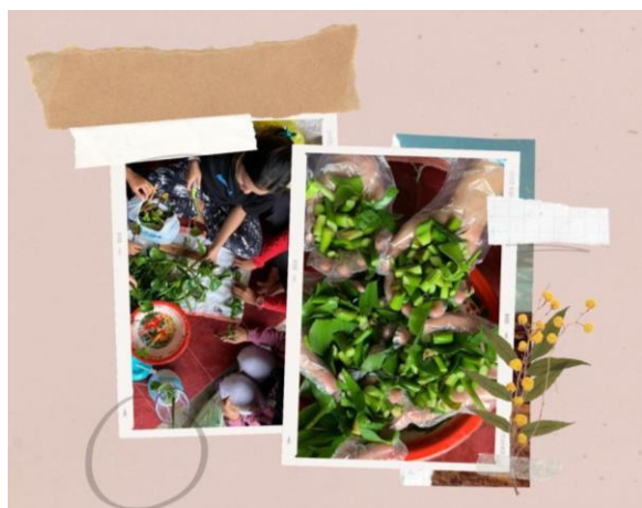
Gambar 1: Proses Pembuatan Sabun Batang Organik