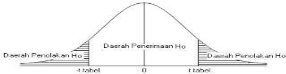
Gambar 01 Kurva Signifikasi Uji t

Berdasarkan hasil output spss versi 24.0, hasil uji – F variabel Gaya Kepemimpinan ( X_1 ), Budaya Kerja ( X_2 ) terhadap Kinerja Karyawan ( Y ) adalah sebagai berikut :