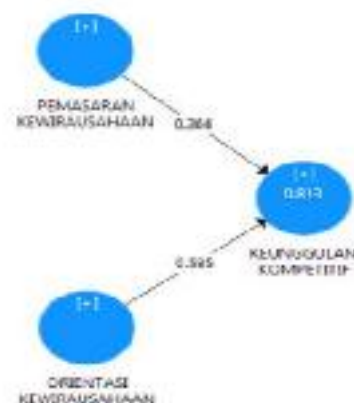
Model Struktural (Inner Model)