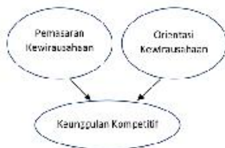
Gambar 1. Model Penelitian

Berdasarkan kajian yang telah diuraikan maka didapatkan model penelitian sebagai berikut: