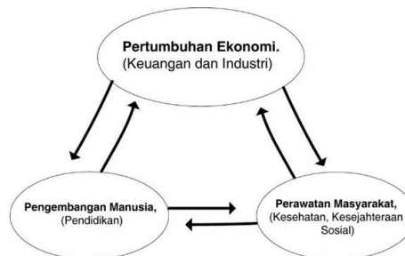
Gamabar 1. Kerangka Berfikir