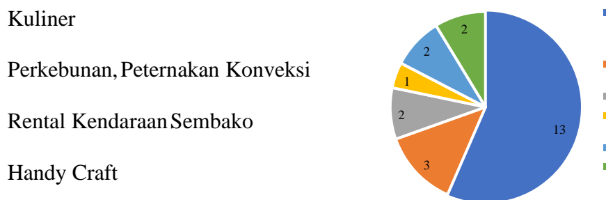
Gambar 1. Jumlah responden UMKM berdasarkan bentuk usahanya

Para pelaku UMKM responden penelitian ini rata-rata telah menjalankan usahanya lebih dari 10 tahun dengan omsetnya berkisar antara Rp 500.000,00 sampai dengan Rp 30.000.000,00.