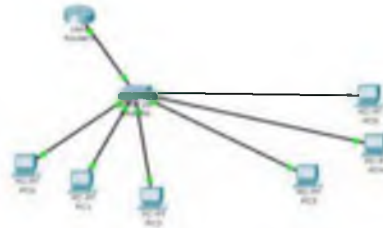
Gambar 4 Inter-VLAN

Pada sebuah VLAN memiliki satu broadcast domain , sehingga pada satu buah komputer tidak dapat terkoneksi dengan komputer yang berbeda VLAN. Agar komputer yang berbeda VLAN dapat terkoneksi maka dibutuhkan perangkat layer-3 yaitu router . Persyaratan router yang dapat dipakai untuk routing VLAN adalah router tersebut harus bisa dibuat trunking ke switch . Oleh karena itu, pada router harus tersedia interface fastethernet dan Internetwork Operating System (IOS) untuk router tersebut juga harus mendukung trunking . Gambar salah satu contoh inter-VLAN dapat dilihat pada gambar 4.