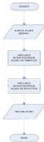
Gambar 5 Perancangan Flowchart konfigurasi inter-VLAN pada cisco berbasis Graphics User Interface (GUI)