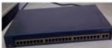
Gambar 2 Switch Catalyst 2960 series

Switch adalah komponen jaringan yang digunakan untuk menghubungkan beberapa HUB untuk membentuk jaringan yang lebih besar atau menghubungkan komputer - komputer yang mempunyai kebutuhan bandwidth yang besar. Switch memberikan unjuk kerja yang jauh lebih baik dari pada HUB dengan harga yang sama atau sedikit lebih mahal. Gambar switch dapat dilihat pada Gambar 2.