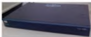
Gambar 1. Router Cisco 2600 series

Router adalah perangkat jaringan yang digunakan untuk membagi protokol kepada anggota jaringan yang lainnya, dengan adanya router maka sebuah protokol dapat di- sharing kepada perangkat jaringan lain. Ciri - ciri router adalah adanya fasilitas Dynamic Host Configuration Proctol (DHCP) yang dapat memberikan user keuntungan dalam membagi IP Address secara oromatis. Salah satu contoh Router dapat dilihat pada Gambar 1.