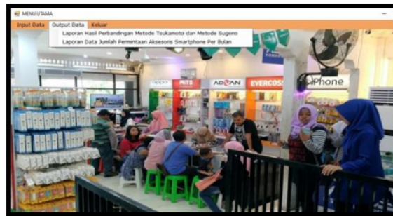
Gambar 5. Sub Menu Output Data