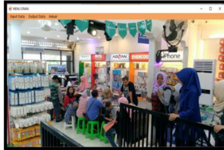
Gambar 3. Form Menu Utama

Merupakan form menu yang memiliki sub menu aplikasi yang dapat digunakan untuk membuka form-form pengolahan data di Aplikasi perbandingan Metode Tsukamoto dan Metode Sugeno Dalam Menentukan Jumlah Permintaan Berdasarkan Penjualan dan Persediaan di Duta Ponsel Sukamerindu. Adapun form menu utama terlihat pada Gambar 2.