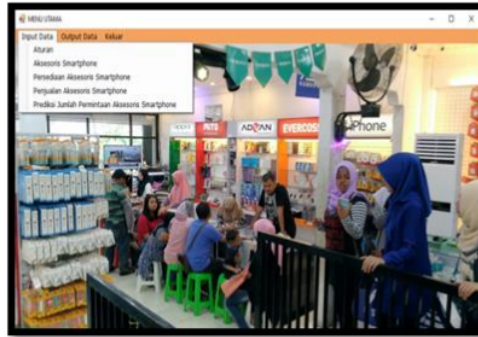
Gambar 4. Sub Menu Input Data