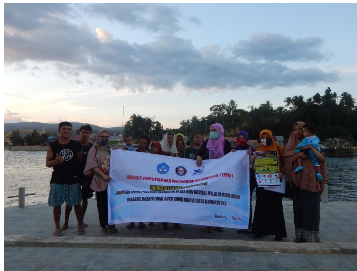
Gambar 10. Foto Bersama di Akhir Kegiatan Tim Pengabdian dan Masyarakat Sama Bajo Bungkutoko

Setelah kegiatan bimtek dilakukan, tim pengabdian bersama-sama masyarakat Sama Bajo Bungkutoko sasaran kegiatan melakukan foto bersama (Gambar 10). Tim pengabdian sangat berterima kasih atas penerimaan masyarakat Sama Bajo Bungkutoko dalam kegiatan pengabdian ini.