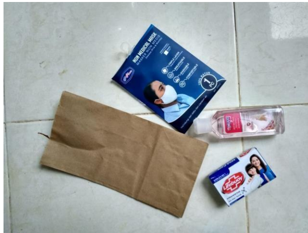
Gambar 3. Paket Perlindungan untuk Mencegah COVID-19 untuk Diberikan Kepada Rumahtangga Sasaran Kegiatan

Setelah melakukan kegiatan pencetakan poster, tim kemudian mempersiapkan paket perlindungan diri yang akan dibagikan kepada 30 rumahtangga sasaran. Setiap paket berisi tiga item barang, antara lain: (1) masker kain yang dapat dipakai berulang-ulang. Hal ini untuk mengurangi limbah medis dari penggunaan masker sekali pakai; (2) sabun batang untuk mencuci tangan; dan (3) hand sanitizer. Semua item tersebut di kemas dalam kantung kertas yang ramah lingkungan untuk mengurangi sampah plastik yang tidak sulit di daur ulang (Gambar 3).