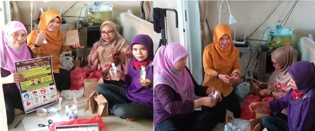
Gambar 4. Kegiatan Tim Pengabdian Masyarakat Mempersiapkan Kegiatan Bimtek dan Mengemas Paket Alat Perlindungan Diri dari COVID-19