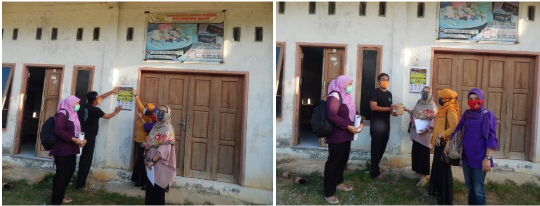
Gambar 6. Penempelan Poster Pencegahan COVID-19 di Kediaman Lurah Bungkutoko dan pemberian Paket Perlindungan Diri dari COVID-19 Kepada Lurah Bungkutoko

Lurah Bungkutoko sendiri, berkenan menempelkan poster pencegahan COVID-19 dalam bahasa Sama Bajo di kediamannya. Tim pengabdian juga memberikan paket perlindungan diri kepada Lurah Bungkutoko (Gambar 6).