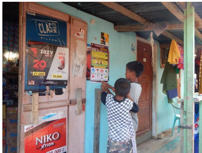
Gambar 11. Anak-anak Sama Bajo Bungkutoko Usia Sekolah Mempelajari Informasi yang Tertera di Dalam Poster Berbahasa Sama Bajo

Efektivitas media diseminasi dimaknai dalam kegiatan bimtek ini sebagai kemampuan media yang didesign dalam menyebarkan informasi dan mempersuasi masyarakat sasaran untuk melaksanakan anjuran terkait pencegahan COVID-19. Setelah melakukan penempelan poster, penyerahan paket alat pelindung diri dari COVID-19, dan penyuluhan singkat door to door , rumahtangga sasaran kegiatan membaca dengan seksama terkait informasi (Gambar 11).