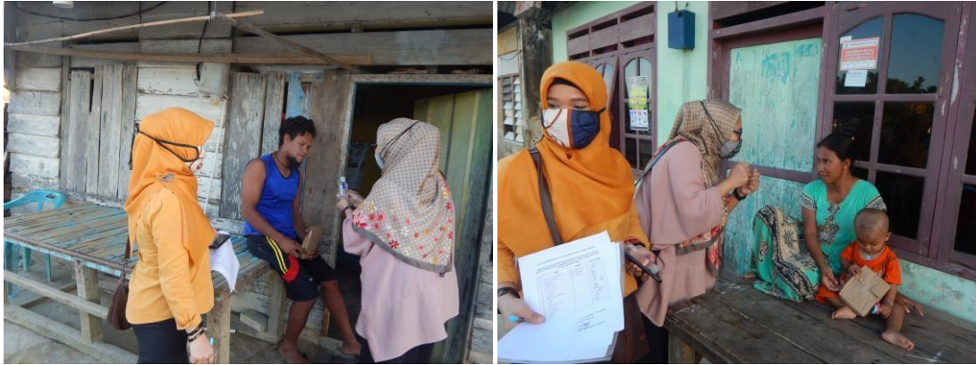
Gambar 8. Tim Pengabdian Mandiri UHO melakukan Penyuluhan Terkait Protokol Kesehatan Mencegah COVID-19

sanitizer agar jauh dari jangkauan anak-anak, dan tidak meletakkan dekat dengan sumber api, agar tidak menyebabkan kebakaran dan keracunan (Gambar 8).