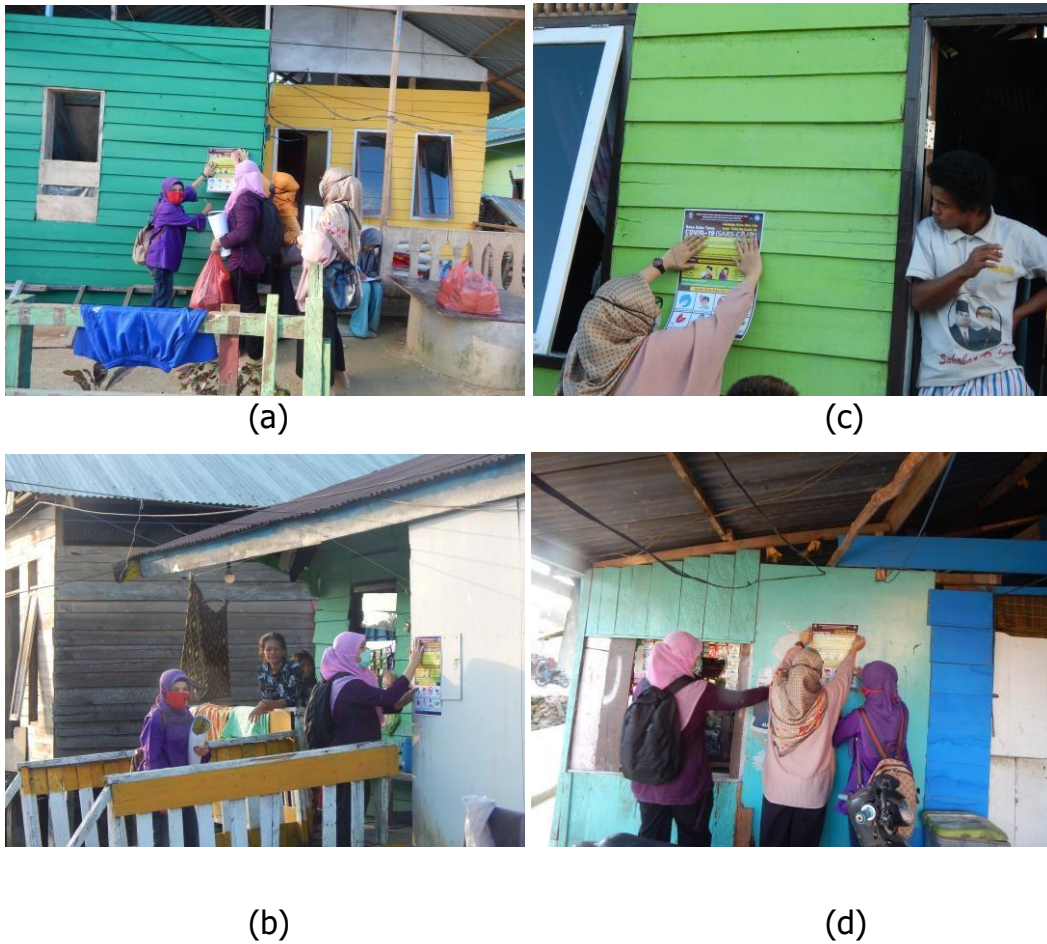
Gambar 7. (a);(b);(c);(d) Kegiatan Penempelan Media Visual Poster Pencegahan COVID-19 secara Door to Door di setiap Rumahtangga Sasaran

Tidak hanya melakukan penempelan poster pencegahan COVID-19 berbahasa Sama Bajo , tim juga melakukan penyuluhan singkat terkait COVID-19, Materi penyuluhan singkat antara lain langkah-langkah pencegahan seperti yang diarahkan oleh WHO, yakni dengan membiasakan menggunakan masker jika akan melakukan aktivitas di luar rumah atau jika sedang sakit flu untuk menghindari penyebaran droplet kepada orang lain. selain menjelaskan tentang manfaat penggunaan masker untuk pencegahan COVID-19, tim pengabdian juga menjelaskan tentang cara mencuci tangan yang benar. Serta menggunakan hand sanitizer yang benar, dan juga menyimpan dengan benar hand