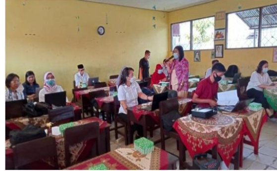
Gambar 3. Kegiatan di SDN 8 Menteng Palangka Raya.