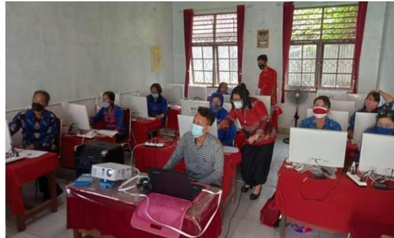
Gambar 4. Kegiatan Pelatihan di SDN 6 Panarung Palangka Raya

Sebagai hasil luaran dari kegiatan Pengabdian Kepada Masyarakat adalah berupa video yang telah dipublikasikan pada you tube dengan link sebagai berikut: https://www.youtube.com/watch?v=8fxHR1rWgo .