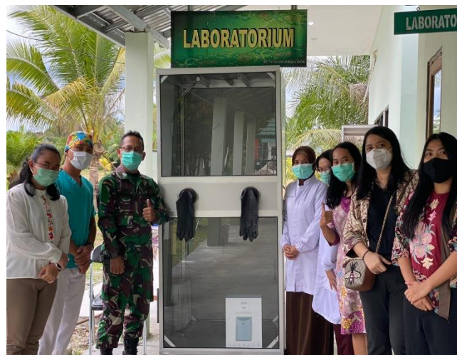
Kegiatan penyerahan bilik swab di depan laboratorium RS TNI-AD Palangka Raya