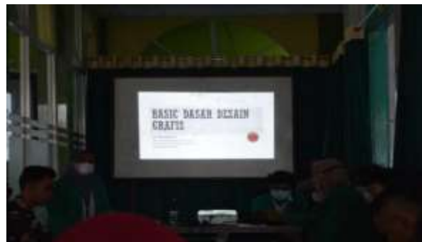
Gambar 3. Penjelasan Materi Mengenai Desain Grafis