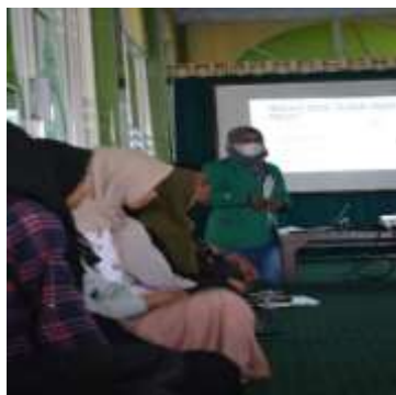
Gambar 4. Penjelasan Materi Mengenai Photoshop