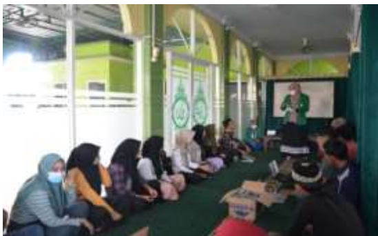
Gambar 2. Pembukaan Acara

Awal dalam kegiatan pelatihan desain grafis dengan memberi materi-materi tentang dasar desain grafis. Yang isinya pengertian dari desain grafis, mengapa harus belajar desain grafis, kategori, unsur mendasar dan kedisiplinan dalam desain grafis beserta aplikasi atau software apa saja yang bisa digunakan dalam membuat desain grafis. Selanjutnya dalam pelatihan ini panitia juga memberi praktek bagaimana cara membuat logo dari aplikasi Photoshop dan diikuti oleh para Remaja Masjid Nurul Huda. Kemudian hasil dari kegiatan pelatihan ini sangat bermanfaat bagi mereka walaupun dalam sebagian peserta ada yang kurang paham tetapi dibantu oleh panitia. Hal ini dapat dilihat dari semangatnya mereka dalam mengikuti pelatihan desain grafis ini dari awal hingga kegiatan selesai, Remaja Masjid Nurul Huda sangat semangat dan disiplin dalam kegiatan pelatihan dan para remaja masjid berfikir bahwa kegiatan pelatihan ini bermanfaat bagi mereka dan dapat meningkatkan pengetahuan mereka tentang desain grafis. Adapun beberapa foto dari hasil partisipasi mereka dalam mengikuti pelatihan desain grafis ini.