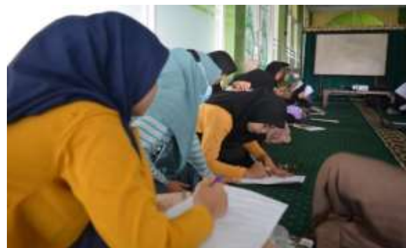
Gambar 5. Mengisi Pre Test dan Post Test oleh Anak Remaja Masjid