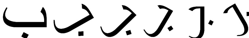
Gambar 2. Citra Huruf Hijaiyah.

Pengumpulan data dilakukan dengan membuat huruf hijaiyah secara manual menggunakan aplikasi desain inspect dengan output gambar format *jpg . Data yang digunakan sebanyak 174 data yang terbagi menjadi 145 data training dan 29 data testing . Masing-masing huruf hijaiyah akan diakusisi sebanyak 6 kali dengan rotasi yang berbeda-beda yakni 0^{\circ} , 30^{\circ} , 45^{\circ} , 60^{\circ} , 90^{\circ} , dan 120^{\circ} . Dari keenam citra tersebut 5 citra akan menjadi data training dan 1 citra akan menjadi data testing untuk setiap huruf hijaiyah. Data training digunakan sebagai data latih, sedangkan data testing digunakan untuk menguji apakah data yang telah di- training menghasilkan luaran yang diinginkan. Gambar 2 menunjukkan citra huruf hijaiyah untuk huruf ba dalam berbagai rotasi.