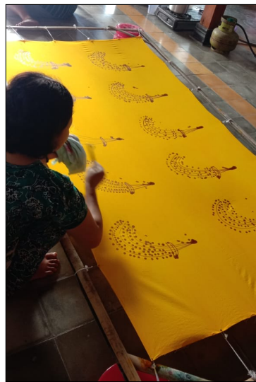
Gambar 8. Hasil Proses Njaplak