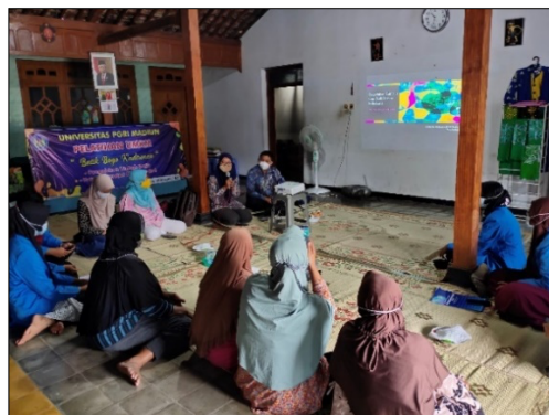
Gambar 3. Workshop Aplikasi Desain

Kegiatan workshop desain abdimas ini menggunakan platform sebagai design adalah Corel Draw dan Photoshop. Pendampingan berupa kegiatan ini bertujuan untuk memberi gambaran penggunaan media digital sebagai pembuatan cap/pola batik nantinya. Untuk memaksimalkan kegiatan ini tim abdimas menampilkan tutorial penggunaan corel draw dan photoshop via video dimana setiap step by step nantinya dijelaskan secara detail. Pada Gambar 3 dan 4 merupakan dokumentasi selama kegiatan pengabdian berlangsung.