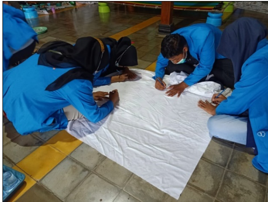
Gambar 7. Proses Njaplak

pastikan media kain tidak bernoda atau kotor hal ini bertujuan pada proses pencelupan warna dapat mudah terserap.