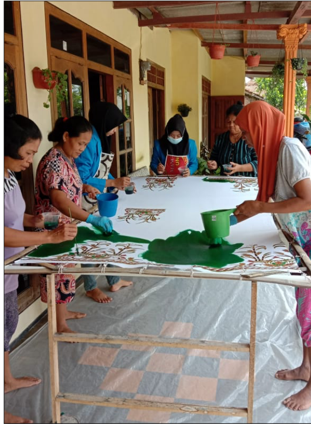
Gambar 10. Proses Pewarnaan

Proses pemberian warna dilakukan dengan menggunakan warna rapid . Tahapan ini dilakukan dengan cara menyapukan warna rapid ke pola/desain yang telah dilakukan proses njiplak sebelumnya. Komposisi larutan rapid adalah TRO dan air dingin dengan perbandingan 2:1.