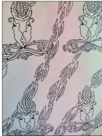
Gambar 5. Desain Motif Baru

Dalam agenda abdimas ini setelah melakukan kegiatan workshop sebelumnya, tim dan mahasiswa mempersembahkan desain batik baru yang disimbolkan kombinasi PGRI sebagai identitas tim abdimas dan jagung merupakan tema dari kerajinan Batik Bogo. Berikut hasil pola batik yang dihasilkan dan dilakukan serah terima kepada ketua kelompok kerajinan.