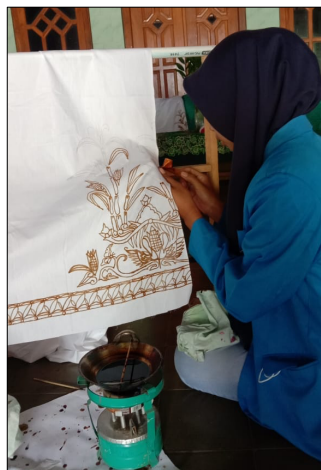
Gambar 9. Proses Nglowong

Setelah tahap awal njaplak selesai, selanjutnya dilakukan proses pemberian malam. Bahan malam sendiri memiliki tiga jenis yaitu malam lowong, malam cetak dan malam putih (paraffin). Proses ini disebut juga dengan istilah proses nglowong.