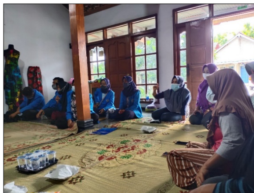
Gambar 4. Forum Tanya Jawab