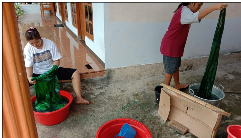
Gambar 11. Proses Pelorodan

Tahap akhir dalam proses pembuatan batik adalah pelorodan, istilah pelorodan dapat diartikan sebagai proses melunturkan malam pada kain batik. Tata cara pelorodan dilakukan dengan cara memasukkan kain kedalam sebuah bak berisikan air panas yang telah ditambahkan soda abu (Soda ASH) dan soda api. Setelah proses pelunturan malam sudah selesai (malam terlepas) kemudian bilas dengan air bersih, peras dan angin-anginkan.