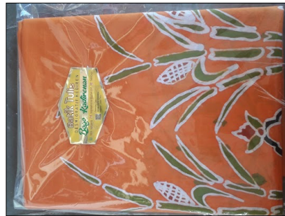
Gambar 2. Packing Batik

Dalam kegiatan workshop ini diharapkan menjadi pengalaman ibu-ibu kelompok kerajinan Bogo membuat inovasi/terobosan pola batik baru untuk kerajinan Batik Bogo agar dapat memaksimalkan sektor promosi dan pemasaran dengan adanya variasi baik motif, kualitas dan corak warna agar menarik lebih banyak peminat Batik Bogo. Kegiatan workshop dihadiri kelompok kerajinan Batik Bogo dan mahasiswa serta dosen (pemateri) berlangsung di rumah produksi Batik Bogo. Sebelumnya dalam perbincangan, ketua kelompok kerajinan yakni ibu susi memaparkan ide pendirian kerajinan Batik Bogo berawal dari kunjungan kegiatan kelompok batik di jogja mulai proses nyungging (pembuatan pola diatas kertas), njaplak hinggal tahap akhir yakni ngelir (pewarnaan). Dari kunjungan tersebut kelompok ibu-ibu pada desa kadirenan mencetuskan membuat kelompok kerajinan Batik Bogo merupakan bahasa jawa yang berarti jagung.