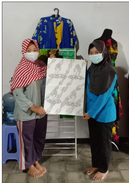
Gambar 6. Serah Terima Desain Batik

Selain itu, para mahasiswa melakukan kegiatan proses membatik dengan para kelompok kerajinan diharapkan generasi muda ini kelak bisa meneruskan warisan budaya yakni kerajinan batik agar tidak punah ditelan zaman. Kegiatan yang dilakukan mahasiswa meliputi empat tahapan utama dalam proses pembuatan batik yakni perencanaan desain batik, pencantingan, pewarnaan dan pelorotan. Deskripsi empat tahapan ini dijelaskan sebagai berikut :