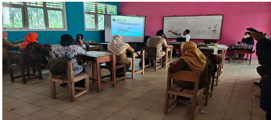
Gambar 2. Pemaparan materi oleh tim

pada jurnal nasional. Para peserta pada tahapan ini terlihat mulai antusias, seperti yang ditunjukkan pada Gambar 2. Hal ini dikarenakan para peserta telah mulai termotivasi berkat usaha dari tim pengabdian yang berupaya membangun kepercayaan diri para peserta.