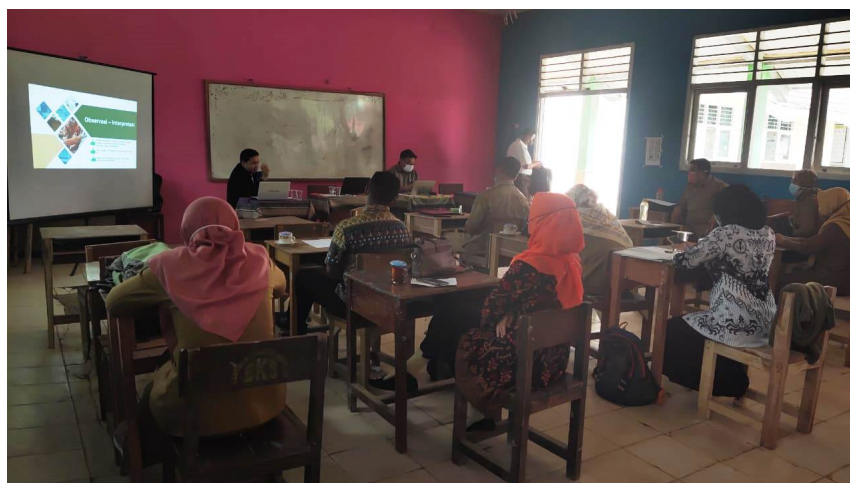
Gambar 3. Demonstrasi dan Tanya jawab

Tabel 2 menunjukkan daftar pembicara pada kegiatan pengabdian kepada masyarakat. Setelah pemaparan materi, dilanjutkan dengan tahap sesi tanya jawab. Pada sesi ini, beberapa peserta yang sangat bersemangat dalam mengajukan pertanyaan. Hal ini membuktikan bahwa kegiatan pengabdian masyarakat terhadap guru SMP Negeri 8 Kubur Raya yang mengusung tema PTK sangat bermanfaat dan membantu para peserta kegiatan. Bahkan ditemukan ada peserta yang sengaja memvideo karena khawatir terlupa akan materi yang disampaikan. Pada sesi ini, juga ditemukan satu peserta yang telah memiliki naskah PTK, namun terkendala di proses analisa data ( tool ) pa yang akan digunakan) dan kondisi kesehatan. Peserta tersebut kemudian menanyakan terkait ( tool ) yang dapat digunakan untuk menyelesaikan naskah tersebut. Sesi tanya jawab terlihat sangat hidup. Sesi Tanya jawab ini terlihat pada Gambar 3.