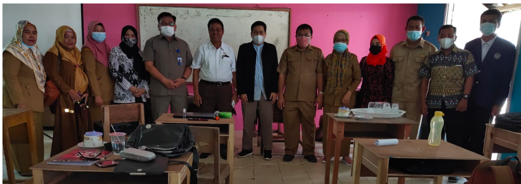
Gambar 4. Foto bersama tim dan peserta kegiatan pengabdian masyarakat