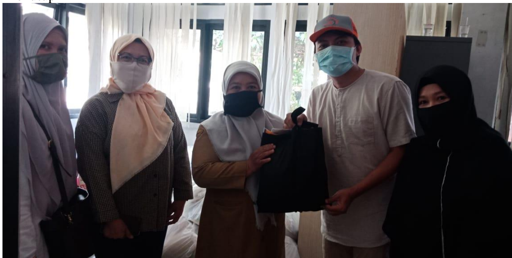
Gambar 3. Kegiatan Sosialisasi, Pencegahan dan Bantuan COVID-19