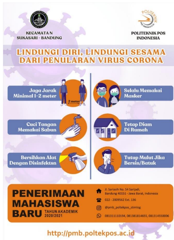
Gambar 2. Flyer Sosialisasi dan Pencegahan COVID-19

Melakukan kesepakatan dalam bentuk MOU yang ditandatangani oleh Camat Sukasari dan dari Politeknik Pos sendiri oleh kepala Lembaga Penelitian dan Pengabdian kepada Masyarakat (LPPM). Setelah itu melakukan pembahasan teknis perihal permasalahan di lapangan dan kebutuhan yang akan di sanggupi oleh pihak PkM dari dosen Politeknik Pos Indonesia dalam hal ini LPPM. Termasuk melakukan desain materi, flyer dan lainnya.