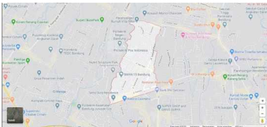
Gambar 1. Peta Kelurahan Sarijadi

Berdasarkan informasi dari Ibu Lurah Kelurahan Sarijadi Kecamatan Sukasari Kota Bandung tahun 2020 jumlah penduduk Kelurahan Sarijadi sejumlah 28.000 jiwa. Februari 2020 lalu, Indonesia terkena penularan wabah penyakit virus corona yang pusat nya dari Wuhan, China [1]. Hampir seluruh kota di Indonesia terdapat kasus virus corona tersebut, termasuk Kota Bandung. Kota Bandung sudah terjadi beberapa kasus penyebaran virus corona termasuk di Kelurahan Sarijadi Kecamatan Sukasari.