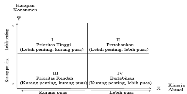
Gambar 1. Diagram Kartesius

kualitas produk Honda Vario yang diterima oleh konsumen. Selengkapnya seperti Gambar 1.