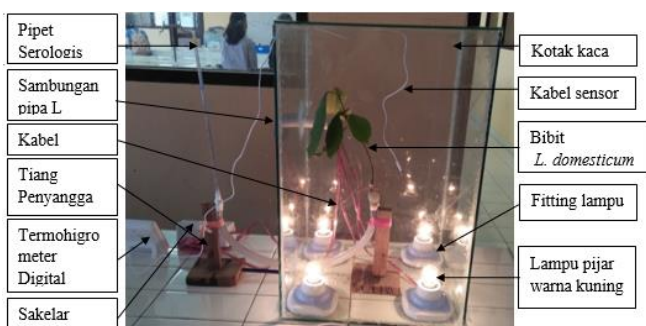
Gambar 1. Rangkaian alat Potometer yang telah dimodifikasi

Penelitian ini dilakukan pada bulan Februari-Maret 2018, bertempat di Laboratorium Fisiologi Tumbuhan, Jurusan Biologi, Fakultas Matematika dan Ilmu Pengetahuan Alam, Universitas Sriwijaya. Metode yang digunakan yaitu metode Potometer [3]. Metode ini dimodifikasi dengan tambahan kotak kaca (50 x 30 cm) dan 4 buah lampu 5 watt yang terhubung pada rangkain. Kotak kaca disatukan dengan lem dan bagian atas tidak dilem, salah satu sisi samping kotak kaca dibuat 2 lubang berukuran 2 cm untuk tempat memasukkan kabel dan menghubungkan alat potometer dengan kotak kaca. Rangkaian sederhana potometer dibuat dengan melengkungkan selang diameter 1,5 cm dan panjang 50 cm. Bagian ujung salah satu selang disambungkan dengan pipet serologi dan ujung yang satunya ditambahkan karet dari sarung tangan latek, kemudian selang diikat pada kedua tiang penyangga yang berada didalam dan diluar kotak kaca hingga membentuk huruf U. Detail gambar rangkaian alat dapat dilihat pada Gambar 1.