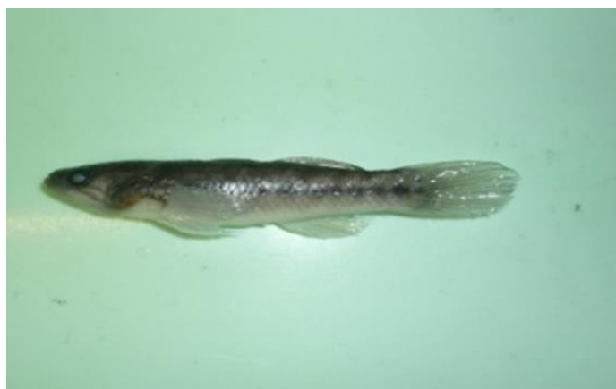
Gambar 3. Ikan yang paling melimpah ( Ophieleotris aporos )

Diantara jenis ikan yang melimpah terdapat satu jenis ikan yang perlu diperhatikan, yaitu Xiphophorus helleri karena merupakan jenis introduksi dari perairan di wilayah Amerika Selatan [3]. Jenis ikan tersebut hanya ditemukan di St.7 (S. Leli). Di lokasi ini tidak ditemukan ikan asli karena perairan tawarnya terbatas. Bahkan masyarakat di wilayah ini sudah memelihara ikan introduksi lainnya pada kolam budidaya yaitu nila ( Oreochromis niloticus ). Jika jenis ikan ini baik ukuran anakan maupun dewasanya lepas ke perairan umum maka dapat mengancam populasi ikan asli karena sifatnya yang sangat adaptif dan cepat berkembang biak.