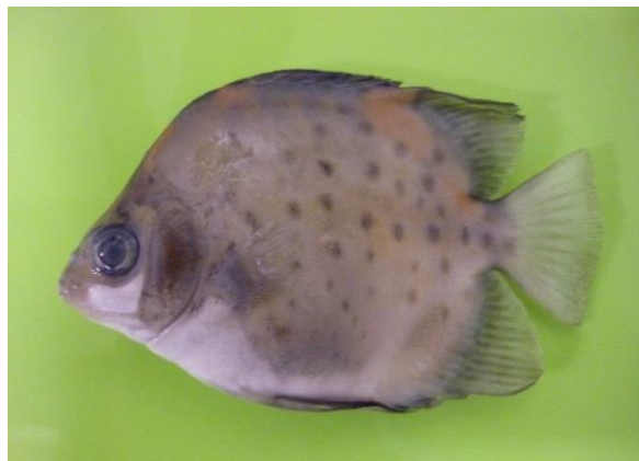
Gambar 6. Ikan berpotensi ganda ( Scatophagus argus )

dimaksud antara lain Scatophagus argus (Gambar 6). Jenis ikan ini umumnya ditemukan di habitat berupa terumbu karang akan tetapi mempunyai kemampuan untuk memasuki perairan sungai di sekitar estuarine. Oleh karena itu termasuk ke dalam kelompok ikan Divisi peripheral [3]. Jenis ikan yang berpotensi ganda lainnya adalah Ambassis miops , Kuhlia marginata , Belobranchus belobranchus , dan Ophieleotris aporos .