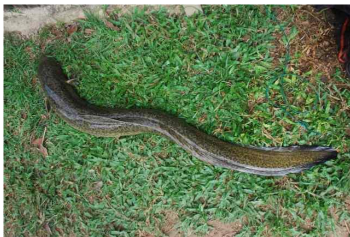
Gambar 5. Ikan konsumsi bernilai ekonomis tinggi ( Anguilla marmorata )

Jenis-jenis ikan yang potensial sebagai ikan hias masih perlu digarap dengan baik melalui pengenalan dan promosi karena belum banyak dikenal oleh para hobiis. Sebaliknya untuk ikan konsumsi terdapat satu jenis yang prospektif dan saat ini banyak diminati oleh banyak kalangan pengusaha, yaitu ikan sogili ( Angilla marmorata ) atau yang lebih dikenal dengan nama sidat (Gambar 5). Kepopuleran dari ikan sidat tidak lain dikarenakan kandungan gizinya yang tinggi baik protein, vitamin A, dan omega 3 yang dipercaya dapat meningkatkan kesehatan tubuh serta meningkatkan kecerdasan anak. Oleh karena itu perlu dilakukan pencatatan tentang lokasi sebaran yang lebih rinci agar dapat diperoleh informasi mengenai habitat ruayanya. Sidat termasuk kelompok ikan diadromus karena di dalam siklus hidupnya melakukan ruaya antar dua ekosistem perairan yaitu air tawar dan laut [18, 19]. Jenis ikan ini pada saat stadia benih ( glass eel ) sampai dewasa hidup di ekosistem perairan tawar yaitu sungai dan danau, sedangkan ketika akan memijah ( stadia silver eel ) akan beruaya menuju ke laut dalam. Proses pemijahan terjadi di kedalaman sekitar 400 m, dan setelah memijah indukan tersebut mati.