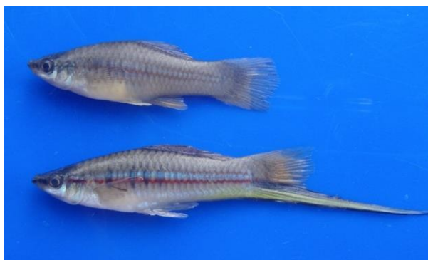
Gambar 7. Jenis ikan introduksi ( Xiphophorus helleri )

Status jenis-jenis ikan tersebut hampir keseluruhan merupakan ikan asli ( native species ) terkecuali Xiphophorus helleri yang merupakan jenis introduksi dari perairan Amerika Selatan (Gambar 7). Hasil ini mengindikasikan bahwa komunitas ikan pada perairan di wilayah Banggai Kepulauan masih baik karena belum banyak ditemukan ikan introduksi.