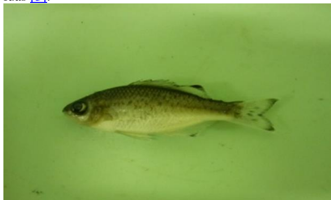
Gambar 4. Ikan yang sebarannya paling luas ( Kuhlia marginata )

Sebaran lokal paling luas dari jenis-jenis ikan yang ditemukan berkisar antara 14,29-85,71% dari tujuh stasiun yang disurvei. Hal ini menunjukkan bahwa tidak ada satu jenis ikanpun yang mempunyai sebaran mutlak di semua perairan tersebut. Adapun jenis ikan yang sebarannya paling luas adalah Kuhlia marginata (Gambar 4) sebesar 85,71%, sedangkan yang hanya ditemukan di satu lokasi (14,29%) jumlahnya mencapai enam jenis (Tabel 3). Sempitnya sebaran ini dapat disebabkan oleh perbedaan kondisi perairan karena pada umumnya jenis-jenis ikan tersebut mempunyai sebaran geografis yang luas [3].