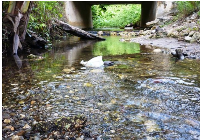
Gambar 2. Kondisi perairan pada St.1 (Sungai Empang)

Hasil analisis kelimpahan terhadap jenis-jenis ikan yang ditemukan sangat bervariasi dengan kisaran 1-14,60 ind./st. (Tabel 3). Jenis ikan yang paling melimpah adalah Ophieleotris aporos (Gambar 3), yang diikuti oleh Eleotris fusca , Schismatogobius marmoratus , dan Xiphophorus helleri .