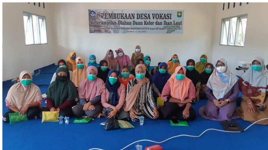
Gambar 2. Bersama Kelompok Ibu kreatif

Penyampaian akhir materi yang diberikan tentang orang sukses akan berhenti mencari alasan mencapai kesuksesannya. Materi ini berisi berbagai motivasi untuk membangun semangat berwirausaha hingga mampu menggapai seluruh apa yang dicita-citakan.