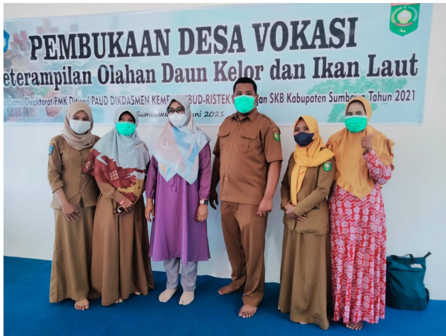
Gambar 3. Bersama Tim SKB Kabupaten Sumbawa.