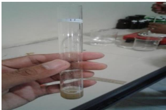
Gambar 2. Hasil uji flavanoid untuk percobaan I menghasilkan warna kuning.