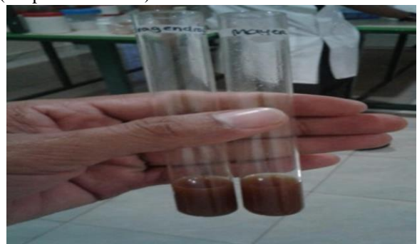
Gambar 5. Hasil uji glikosida untuk percobaan I dan percobaan II tidak menunjukkan perubahan warna (tetap warna coklat).