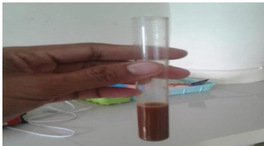
Gambar 1. Hasil uji saponin menunjukkan hilangnya buah pada sampel.