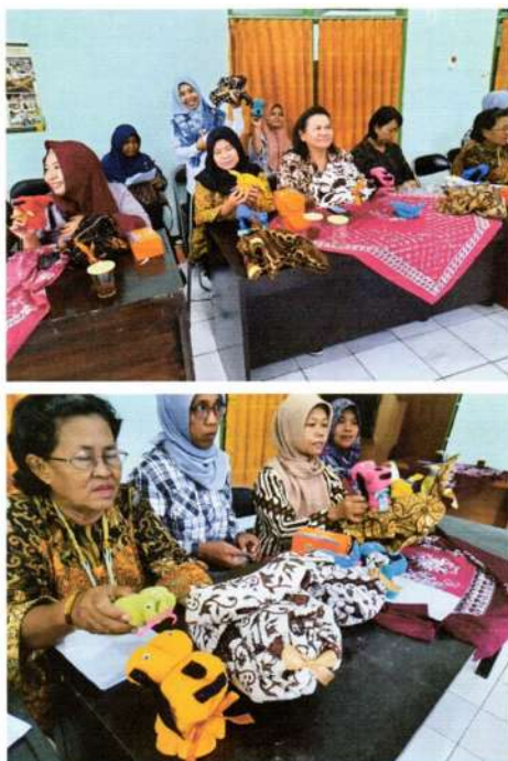
Gambar 3. Proses pembuatan