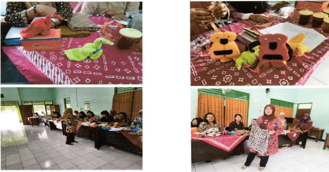
Gambar 2. Penjelasan pembuatan hantaran

Pelatihan hantaran ini secara garis besar terbilang berhasil dan sukses karena banyak peserta yang hadir. Dalam pelatihan pembuatan seni lipat melipatpun peserta antusias sekali untuk bertanya jika mereka ada yang kurang jelas. Bahkan ada yang bertanya jika hantaran ini untuk bisnis prospek ke depannya baik apa tidak. Dan peserta juga menanyakan kelanjutan pelatihan hantaran dalam bentuk yang berbeda dan bahan yang berbeda, sehingga jika untuk mencari uang bagi mereka bisa dilakukan.