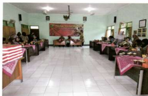
Gambar 4. Foto bersama peserta