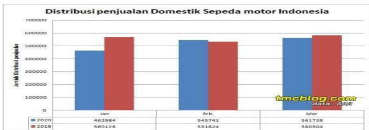
Tabel 1 Data Penjualan Sepeda Motor di Indonesia 2019-2020

Sumber : Data AISI Penjualan Motor (2020)