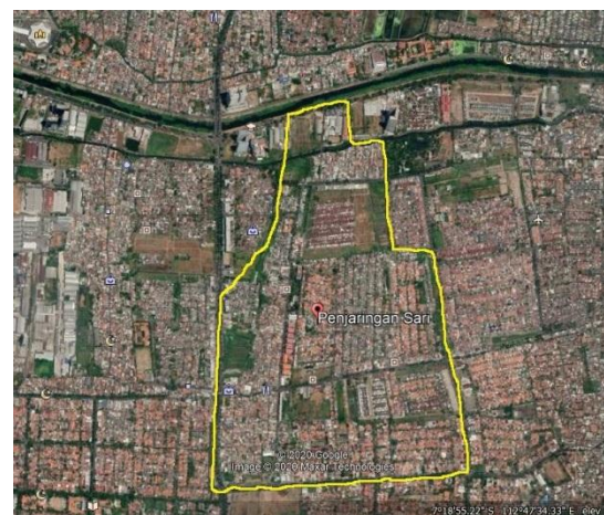
Gambar-1: Peta Kelurahan Penjaringan Sari

Penelitian ini dilaksanakan untuk menganalisa pengaruh pandemi COVID-19 terhadap timbulan dan komposisi sampah, kedua data diatas akan dibandingkan dengan data penelitian sebelumnya yaitu data timbulan dan komposisi sampah rumah tangga sebelum dan saat pandemi COVID-19 dengan dilakukan uji beda rata rata menggunakan software statistik.